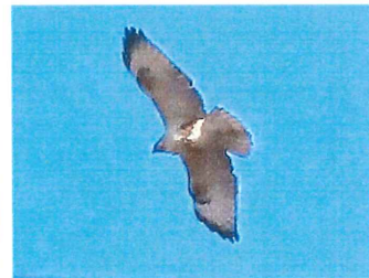
ノスリ 狩の時、野をする ような地表スレスレを飛翔 するので名がついた