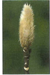
拳 コブシ 2月なのでまだ花芽は小さい 3月には花開く準備ができる