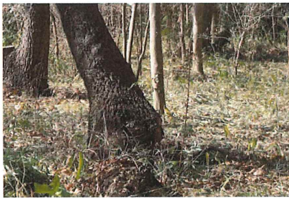
クヌギ オオミコブタケというキノコに侵食され、木の幹が崩れ倒れてしまった