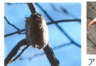
ハラビロカマキリ卵