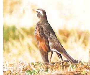
ツグミ このような姿 勢の時は、周囲を警戒し ている