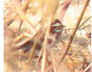
カシラダカ 昨年は見 かけなかったが、今年 は多い