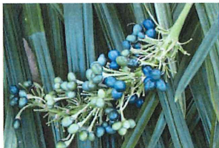
熨斗蘭 ノシラン 冬にラピスラズリのような青い実をつけるが今年は薄い色味