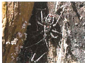
ヨコツナサシガメ 幼虫で越冬