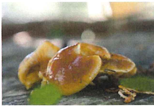
榎茸 エノキタケ 食可能 いつもの切り株に数箇所でできていた