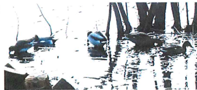
ヒドリガモ♂♀ (左) マガモ♂♀ (右)