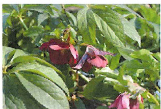
クリスマスローズ 園