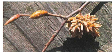
アカシデメムレマツカサフシ 赤四手芽群松毬五倍子こう書くと伝わりますか？虫コブです