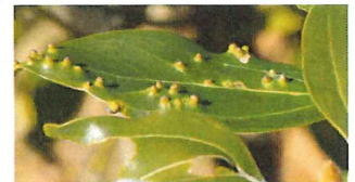
シロダモハコブフシ 虫コブはダニやタマバエの幼虫が植物に寄生することで、植物の組織がコブのように膨れたもの