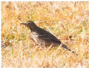
タヒバリ 13羽グランド