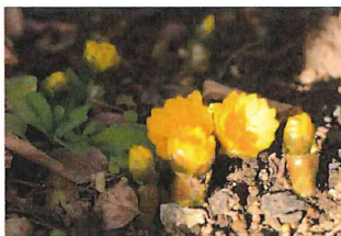
福寿草 フクジュソウ