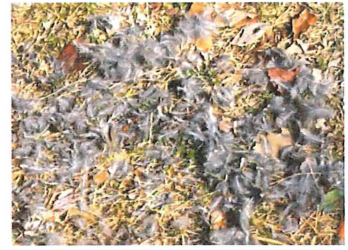
猛禽に襲われたヒヨドリ羽毛