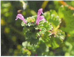
仏の座 ホトケノザ