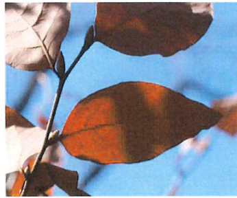
山香ばし ヤマコウバシ 枯れ葉をつけたまま越冬する珍しい木 冬でも葉が落ちないことで、受験生のお守りになっている 枝葉を折ると生姜のような良い香りがする