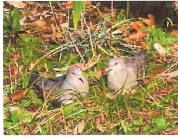
キジバト 仲良いカップル