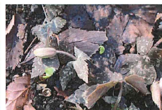
雪割一華 ユキワリイチゲ