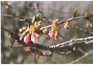
河津桜 カワツザク