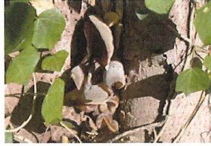
荒毛木耳 アラゲキクラゲ 食可能 これも沢山できていた