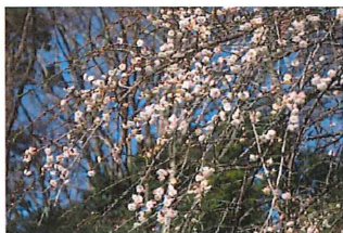
枝垂れ梅 シダレウメ