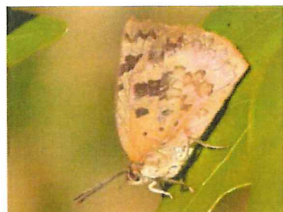
ムラサキシジミ 成虫のまま越冬