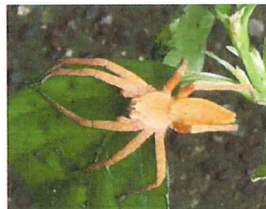
イオウイロハシリグモ 25mm