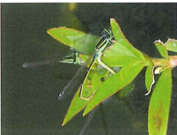
アオモンイトトンボ 交尾中 ♂、♀ともに同色 50mm