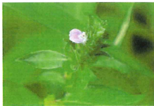
狐の孫 キツネノマゴ