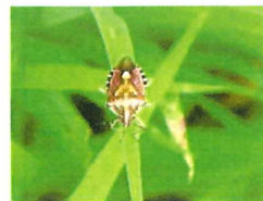
ブチヒゲカメムシ 12mm