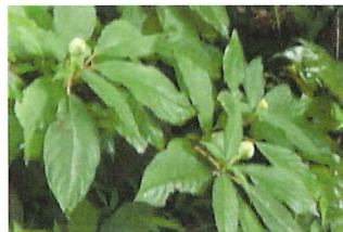
玉紫陽花 タマアジサイ蕾