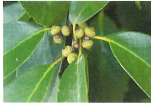
荒櫨 アラカシ ドングリ