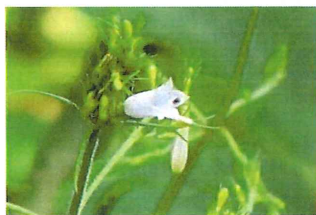
釣鐘人参 ツリガネニンジン