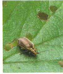
サンゴジュハムシ 6.5mm ガマズミの 葉食べる