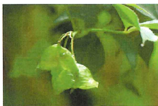
三葉卵木 ミツバウツギ実