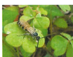
オオモンツチバチ 22mm