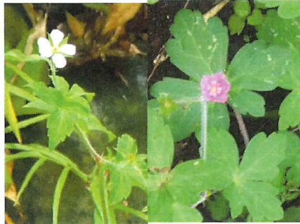
現の証拠 ゲンノショウコ 関東は白花、関西以西は赤花でしたが増えました