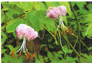
鹿子百合 カノコユリ