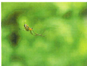
チュウガタシロカネクモ 9-11mm