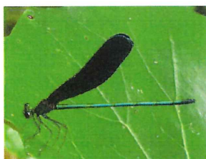
ハグロトンボ♂ 金緑色

川で生まれ、未熟なうちは川を離れて近くの林地に移り、林床で生活する。成熟すると川に戻り繁殖する。