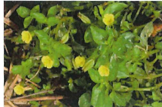
溝鬼灯 ミゾホオズキ