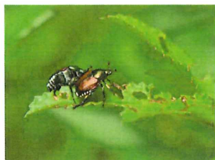
マメコガネ 9-11mm いく るいな葉についていた