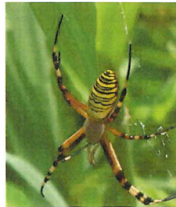
ナガコガネグモ 25mm 表と裏