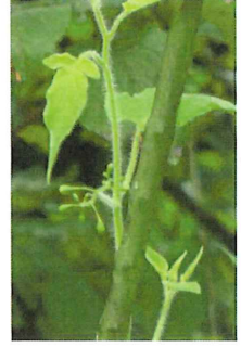
鶴上戸 ヒヨドリジ ヨウゴ 実