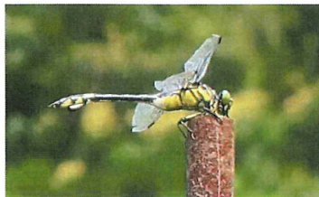
ウチワヤンマ 80mm サナエトンボの仲間