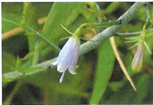
釣鐘人參 ツリガネニン ジン