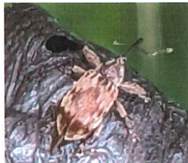
ナシハナゾウムシ 3.5mm