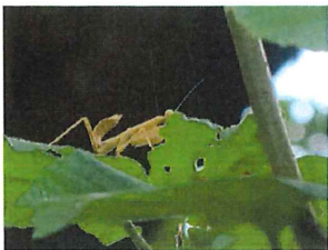
ハラビロカマキリ幼虫 お尻を跳ね上げている