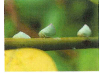
アオバハゴロモ 鳩ぽっぽとも言う