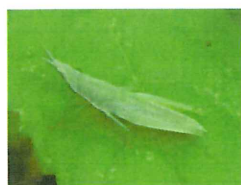
オンブバッタ幼虫 30mm