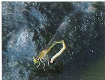
アオモンイトトンボ 産卵中 ♀色違い