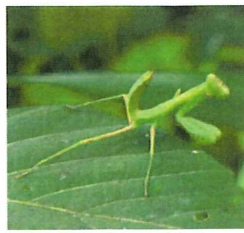
ハラビロカミキリ 幼虫 40mm