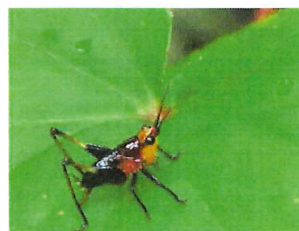
ササキリ幼虫 20mm 小さなキリギリス

川で生まれ、未熟なうちは川を離れて近くの林地に移り、林床で生活する。成熟すると川に戻り繁殖する。