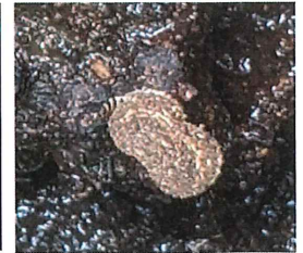
マダラマルハヒロズ コガ 10mm ミノム シの仲間