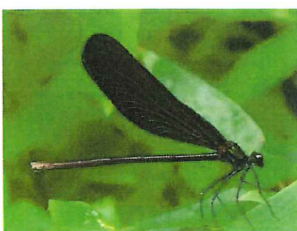
ハグロトンボ♀ 黒褐色

古い時代に稲と一緒に渡来、実や根は生薬として使われる。 雌花は苞鞘の中にあり白い2本の柱頭だけを出して花粉をキャッチする。苞鞘から出た雄花の穂でワンセットの花となっている。