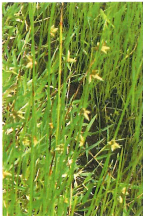
蛍草 ホタルイ ホタルの飛びそうな場所に生えているので名がついた