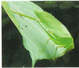
サトクダマキ モドキ 50mm