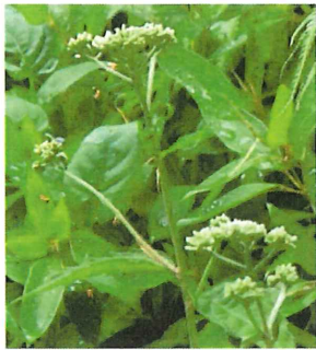
男郎花 オトコエシ オミナエシよりがっしり