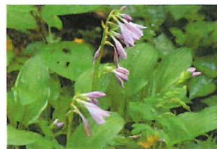
小葉の擬宝珠 コパノギボウシ