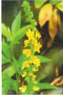
金水引 キンミズヒキ 水引に似ているので

野の花苑 田んぼで生まれたニホンアマガエルが、小さな体で道路を渡ってここで暮らしています。