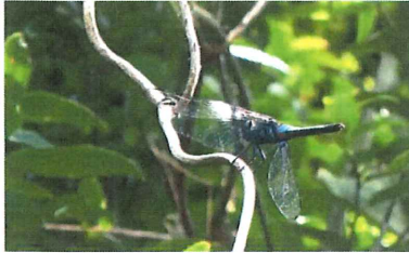
オオシオカラトンボ♂60mm