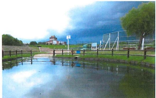
蜻蛉を眺めていたら黒雲がわき稲光も、ここで終了