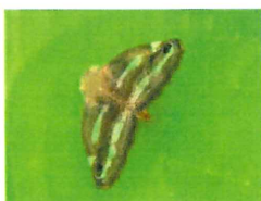
ベッコウハゴロモ 10mm