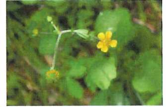
大根草 ダイコンソウ