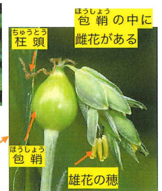
数珠玉 ジュズダマ 外

古い時代に稲と一緒に渡来、実や根は生薬として使われる。 雌花は苞鞘の中にあり白い2本の柱頭だけを出して花粉をキャッチする。苞鞘から出た雄花の穂でワンセットの花となっている。