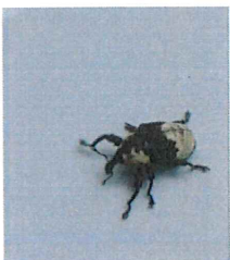
オジロアシナガゾ ウムシ 10mm