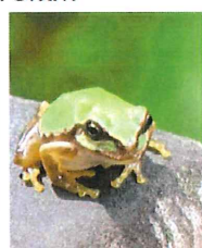
ニホンアマガエル 今年生まれのカエルたち、みんな2cm弱です 田んぼで生まれ、1cm ぐらいの大きさと道路を渡って森や野の花苑で暮らします

見聞きした生き物 野鳥：ウグイス・ガビチョウ・ヒヨドリ 昆虫：ミンミンゼミ・クマゼミ・ アブラゼミ・ヒグラシ・ツマアカクモバチ・トウキョウヒメハンミョウ・オニヤンマ・コシアキトンボ♀ スジグロシロチョウ・モンキアゲハ・キタキチョウ・コムスジ・ベニシジミ・ヒメグモ