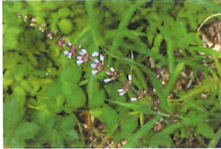
秋の田村草 アキノタムラ ソウ