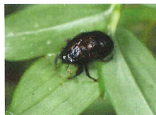
ニイニイゼミ 幼 20mm 幼虫のまま外にいるのは 羽化に失敗したのか