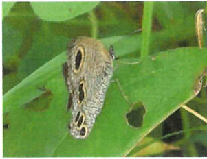
ヒメウラナミジャノメ 20mm