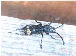
ナガフトヒゲナガゾ ウムシ 18mm