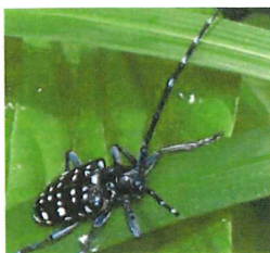
ゴマダラカミキリ 35mm