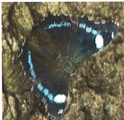
ルリタテハ 60mm 羽を開いたところ と、閉じたところ。コナラの木肌にそっ くり