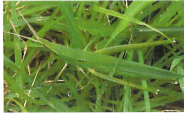
ショウリョウバッタ 80mm