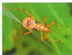
アカサシガメ幼虫 15mm