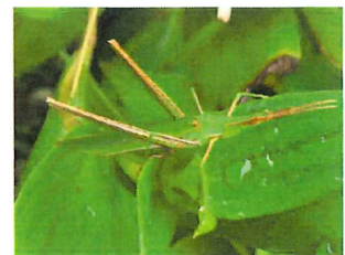
ショウリョウバッタ 40mm