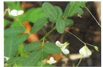
蒔絵萩 マキエハギ