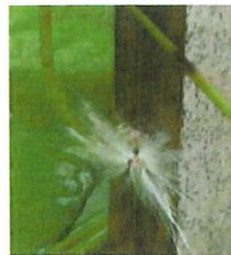
ベッコウハゴロモ 幼虫 3mm 見晴 らしの丘に成虫が いた