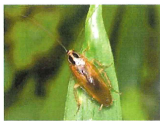
モリチャバネゴキブリ 11-13mm