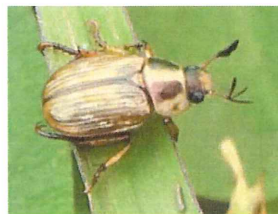
セマダラコガネ 8-13.5mm クシのついた触覚かわいい