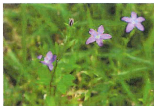
雛桔梗草ヒナキキョウソウ外