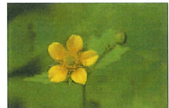
大根草 ダイコンソウ