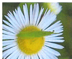
オンブバッタ幼虫 15mm