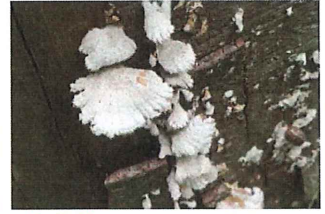
末広茸 スエヒロタケ