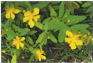
未央柳 ビヨウヤナギ園 中国原産キンシバイと混同