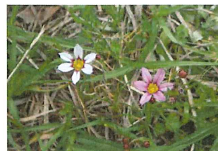
庭石菖 ニワゼキショウ外