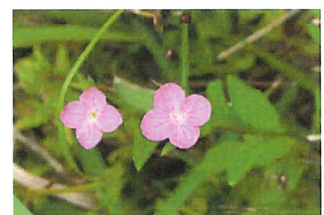
赤花夕化粧 アカバナユウゲショウ外

振花 ネジバナ 螺旋状に巻きつくよう に花をつけるランの仲 間、小さな花を虫眼鏡 でよく見て