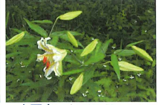
山百合 ヤマユリ 昨年より多くの花が咲く