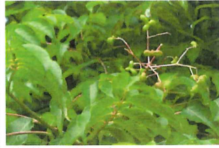
権葎 ゴンズイ 緑の実が秋には赤くなる