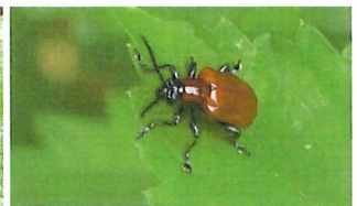
アカクビナガハムシ 9mm