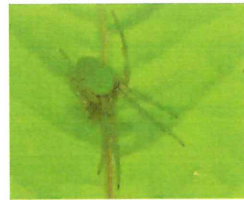
サツマノミダマシ 7.5-11mm ハゼの実に似ている