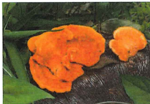
緋色茸 ヒイロタケ