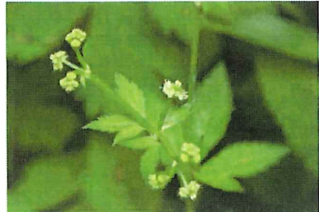
馬の三葉 ウマノミツバ ミツバに似ているが食用ではない