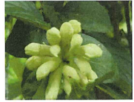
エゴノメコアシフシ エゴノキにつく虫コブ