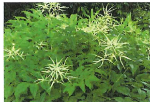
山吹升麻 ヤマブキショ ウマ葉が山吹に似ているため