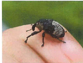
オジロアシナガゾウムシ 9mm クズの葉によくいる