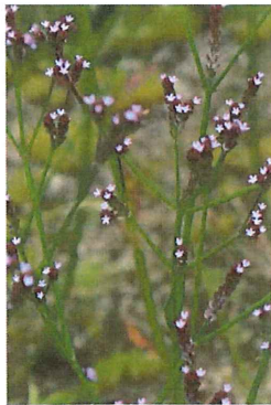
荒地花笠 アレチハ ナガサ 外