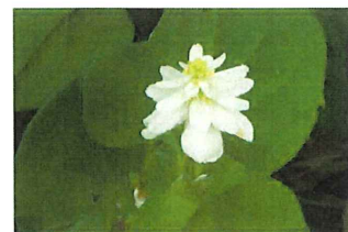
八重薺草 ヤエドクダミ