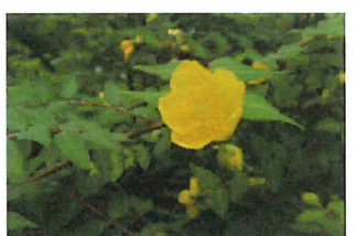
金糸梅 キンシバイ園 中国原産ビヨウヤナギと混同