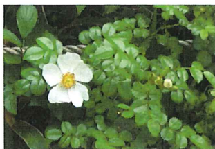
照葉野茨 テリハノイバラ