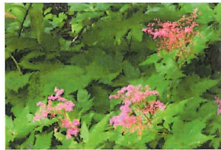
京鹿子 キョウカノコ園