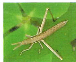
ショウリョウバッタ幼虫 30mm