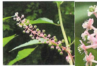
洋種山牛蒡 ヨウ シュヤマゴボウ外