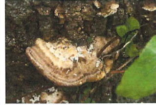
大実の粉吹茸 オオミノ コフキタケ