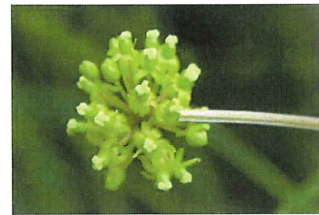
牛尾菜 シオデ 新芽は森のアスパラガス