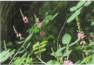
木立駒繫 キダチコマツ ナギ 外 中国原産