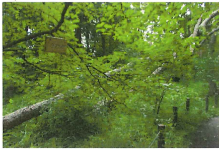
先日の台風でカシナガの被害を受け たコナラが2本倒れた