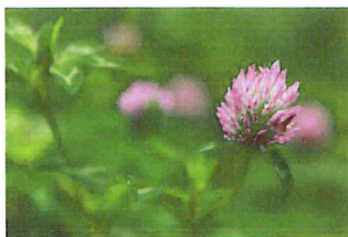
赤詰草 アカツメクサ外