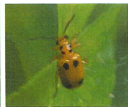
キベリクビボソハ ムシ 7mm