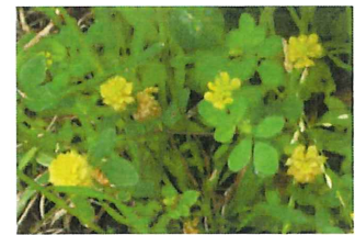
薬玉詰草クスダマツメクサ外