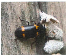
ヒメオビオオキノコ 9-13mm スエヒロタ ケを食べていた