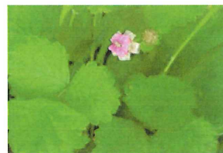
苗代苺 ナワシロイチゴ