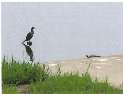
カワウ ミシシッピーアカミミ ガメ