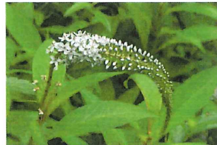
丘虎の尾 オカトラノオ