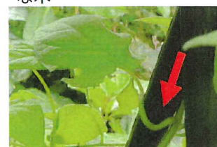
鶴上戸 ヒョドリジョウゴ 全体に軟毛が密生し、葉柄で他に絡みつく。夏から秋、葉と対生して花柄を出し、白い花を下向きにつける。赤い実は有毒。