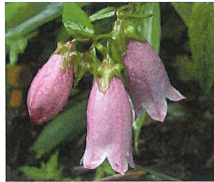
山蛸袋 ヤマホタルブクロ