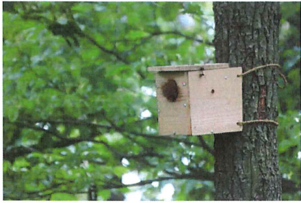
シジュウカラの巣箱がクリハラリスに 乗っ取られ、入口が齧られる 2.8mmの穴が50mmの穴になる