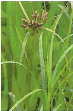
三角蘭 サンカクイ 茎の断面が三角