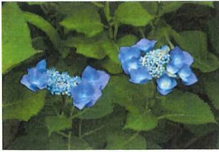
萼紫陽花 ガクアジサイ