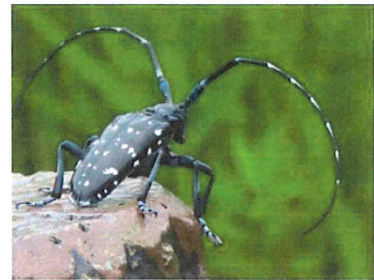
ゴマダラカミキリ 25-35mm 触覚も立派で存在感がある