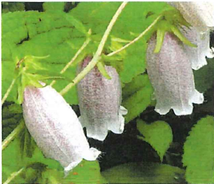
蛸袋 ホタルブクロ

野の花苑 白から赤紫色のホタルブクロの花が咲いています。よく見ると花の萼の形が違います。蛸袋と山蛸袋の違いを見つけてください。