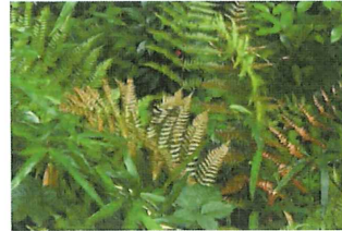
紅羊歯 ベニシダ 公園内に多いシダ、若いうちは 紅紫色 葉の裏側にはソーラスという胞子嚢軍が綺麗に並ぶ