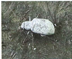
リンゴコフキハムシ 6-7mm