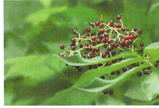
接骨木 ニワトコ 小さな赤い実は野鳥が食べる