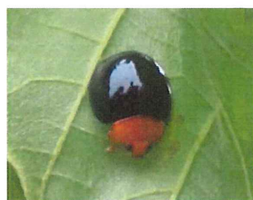
ムネアカオオクロテ ントウ 外 台湾原産 6-8mm マルカメムシ の幼虫を食べる