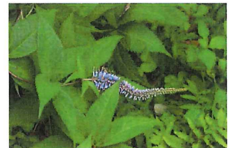
九蓋草 クガイソウ 葉が九段つくと花が咲くという