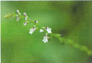
蠅毒草 ハエドクソウ 根を煮出してハエ取紙を作った