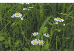
姫女苑 ヒメジョオン外