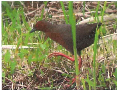
ヒクイナ 夏鳥 いつもは遊水地 で見かけるのに、田んぼ畦道を歩く