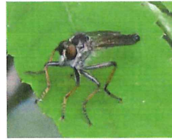
マガリケムシヒキ 15-20mm