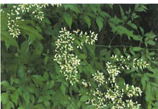
南天 ナンテン ..