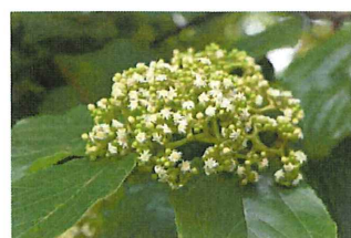
玄圃梨 ケンポナシ 高木で花が見えない