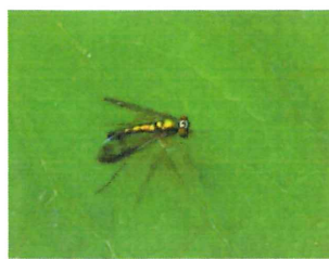
アシナガバエ 10mm 微小な昆虫、ダニを食べる