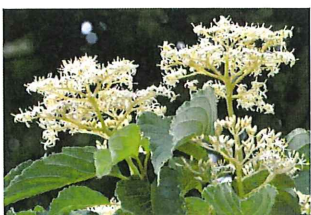
熊野水木 クマノミズキ 花は水木より遅く咲き黄味がかる