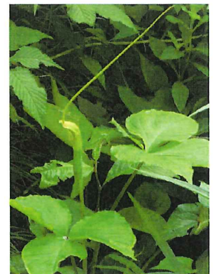
大半夏 オオハンゲ 本州中部以西に分布していたが、最近増えている