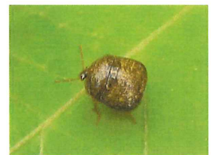
マルカメムシ 4-5mm クズやハギにつく、臭 い匂いを出す