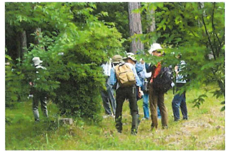
木の葉についている昆虫を調べる