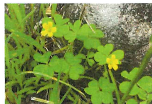
おっ立ち片喰 オッタチカ タバミ外