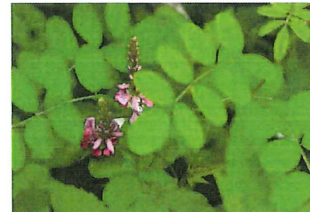
駒繫 コマツナギ 馬を繋げるくらい丈夫な木