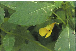
黄釣船 キツリフネ 9月まで花が見られる