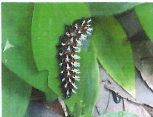
ルリタテハ 終齢幼虫 ホトトギスの葉にいた