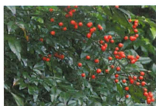
南天 ナンテン 難を転ずると縁起が良い植物 薬用 咳止め効果