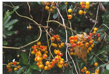
蔓梅擬 ツルウメノドキ