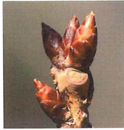
河津桜 カワヅザクラ 芽鱗 は無毛カンヒザクラとオ オシマザクラの雑種