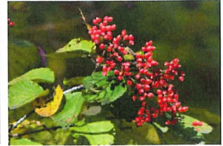
蒲染 ガマズミ 古くは 衣類の染め物として使用