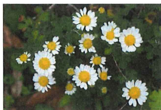
野路菊 ノジギク 海岸線の崖で咲くキク