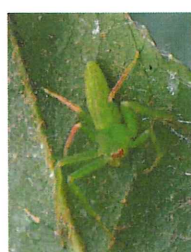
ワカバグモ♂ 待ち伏せスタイル