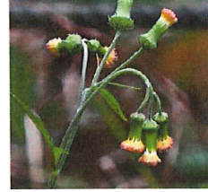
紅花檻樓菊 ベニバナボロギク 外