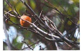
柿の木 カキノキ 鳥 が運んだタネから育つ