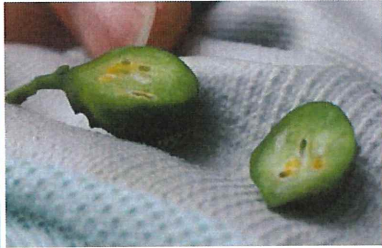
イヌツゲメタマフシ 虫えい(虫こぶ) 芽がコブの ようになり、内部に虫が見つかる 割ると U 字 型に曲がった虫室に、各 1 匹イヌツゲタマバエの幼 虫がいる