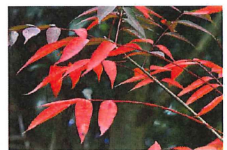
櫨の木 ハゼノキ 鮮やかな赤