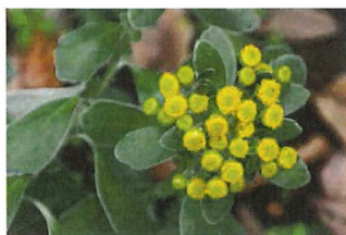
磯菊 イソギク 花はこれ以上開かず