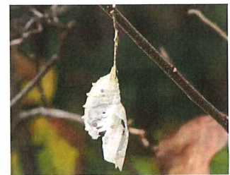
タテハチョウ 脱皮あと

くわくわ森 花は少なくなりましたが、木の実はたっぷり、とくにムラサキシキブの 実はたくさん実って紫色に輝いています。