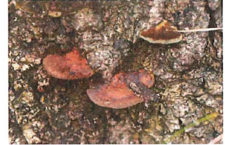
ネンドタケ 枯れ木にできる