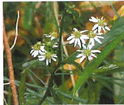
白嫁菜 シロヨメナ