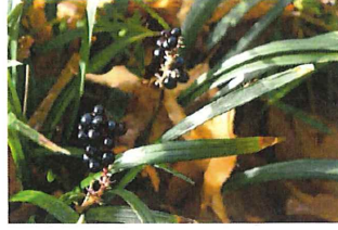
藪蘭 ヤブラン 黒い実 は皮を剥くと弾む