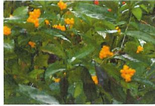
黄実千両 キミセンリョウ 野の花苑の実を鳥が運ぶ