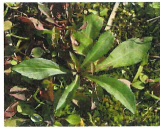
背高泡立草 セイタカアワダチソウ