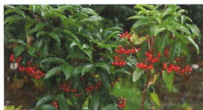
万両 マンリョウ たっぷり実をつけて鳥を待つ