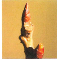
啓翁桜 ケイオウ ザクラ 支那実桜と 小彼岸桜の交配 切花 として使われる