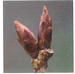
山桜 ヤマザクラ 芽鱗は 6-9mm 長 卵形で無毛