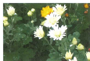
家菊 イエギク 園 観賞用に栽培されるキク