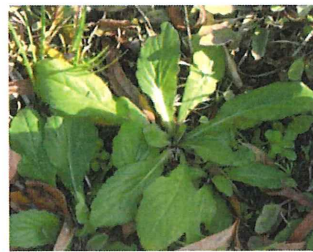
春紫苑 ハルジオン