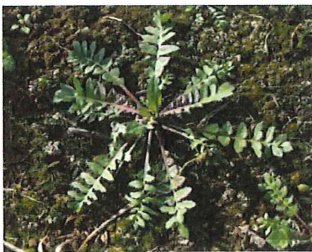
薺 ナズナ (ぺんぺん草)

ロゼットは（バラの花）の意味があり、茎を立ち上げず地際から直接広がって、バラの花のような形をする植物のことをいいます。茎を作るのにもエネルギーが必要なので、寒い間は省エネで葉をいっぱい広げて太陽の光を浴びています。