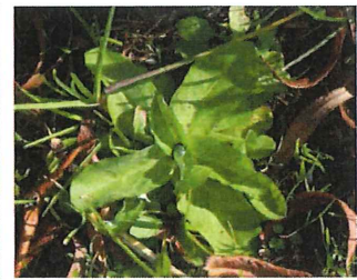
裏白父子草 ウラジロチチコグサ