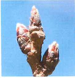
江戸彼岸 エドヒガン 芽鱗は 3-4mm 灰 色の毛が密生する