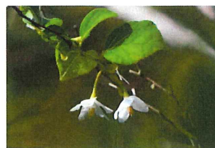
エゴノキ 季節を間違えて咲いている