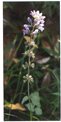
秋の田村草 アキノタムラソウ