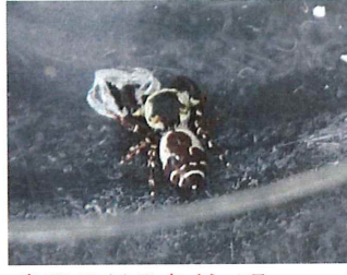
カラスハエトリ ♂5mm ♂は黒っぽく ♀は白っぽ い