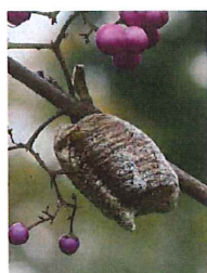
ハラビロカマ キリの卵のう