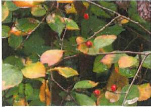
鎌柄 カマツカ キノコ