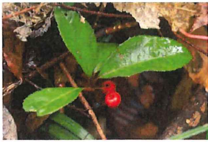
藪柑子 ヤブコウジ (十両)