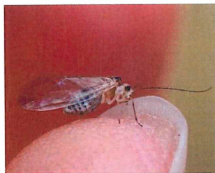
ホソチャタテ 6mm 常緑樹の葉裏のカビを 食べる