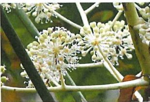
八手 ヤツデ 花の少な い時期昆虫たちの蜜源