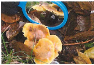
エノキタケ 野生 食用 カサは3cm 大柄は暗褐色