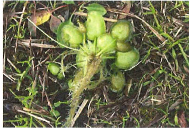
アマゾンチカガミ 外 中南米原産 アマゾンフロッグピットの名前で観賞用に販売されているが、これが逸脱して広がっている。風媒とされ繁殖力が強い。