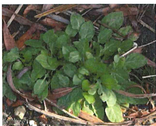
姫昔蓬 ヒメムカシヨ モギ