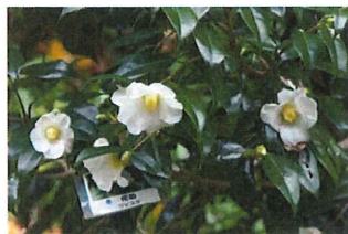
白侘助 シロワビスケ メジロが蜜を吸いにくる