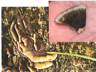
ヤケイロタケ 枯れ木にできる、裏側は 焦茶色