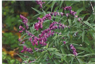
アメジストセージ 園 花が少ないので昆虫たちの蜜源です