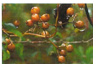
屁糞葛 ヘクソカズラ 匂いが嫌われるが秋のツルは飾りになる