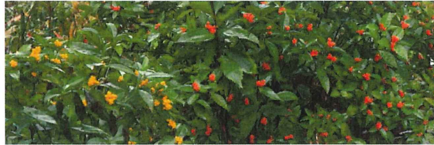
黄実千両 キミセンリョウと千両 センリョウ 花の代わりに庭を彩っています 野鳥の貴重な餌になる