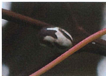
イガラ 繭 蛾が出て穴のあいた殻を桶に見立て、雀の小便田子スズメのショウベントゴ(トイシ)と言われていた