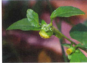
雁首草 ガンクビソウ 花のつき方が煙管(きせ る)の首に似ているので