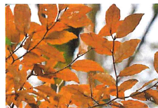
山香ばし ヤマコウバシ 枯れた葉は春まで残る