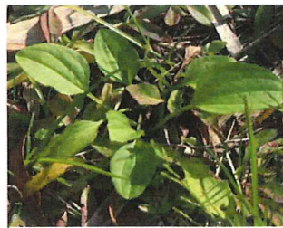
大葉子 オオバコ (車前草)