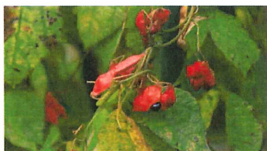
吐切豆 トキリマメ 今年は莢の赤が鮮やか