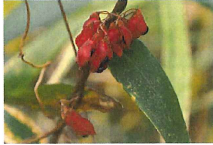
吐切豆 トキリマメ 森の中でも増えてきた