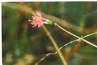
鶯神楽 ウグイスカグラ 早くも咲き出す