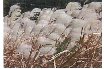
荻 オギ ススキと間 違えられやすい