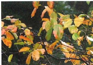
油瀝青 アブラチャン