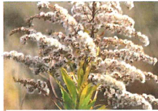
背高泡立草 セイタカ アワダチソウ外原産