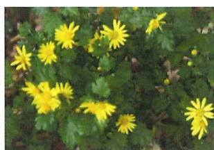
山陰菊 サンインギク 山陰地方で多い