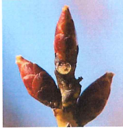
大島桜 オオシマザクラ 花芽は 7-8mm ツ ヤがあって無毛