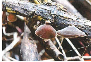
アラゲキクラゲ 野生 食用 雨後なのでふっくら と美味しそう