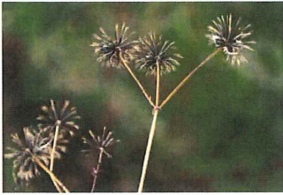
コセンダングサタネ 外 痛くて困るひつつき虫