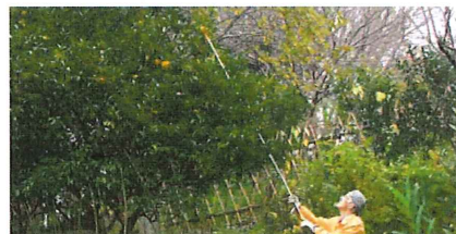
柚子 ユズ 実は収穫してジャムに

雨粒が残り7くらいしかない寒い朝でしたが、せせらぎでは キセキレイ が餌を探し、少しの晴れ間には エナガ 、 メジロ 、 シジュウカラ 、 コゲラ の混軍があらわれ餌をついばんでいました。そのほかは ヒヨドリ 、 ハシブトガラス 昆虫は見当たりませんでした。