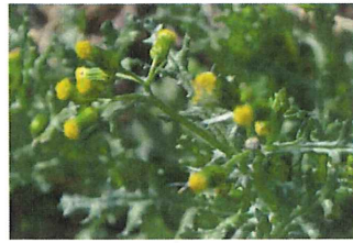
野檻樓菊 ノボロギク 外 欧州原産