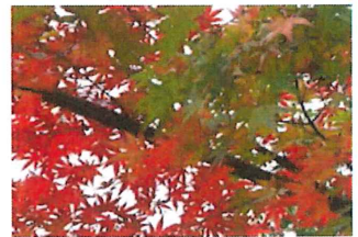
伊呂波楓 イロハカエデ