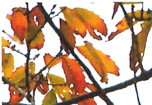
榎 クヌギ 日当たりの 良いところは綺麗