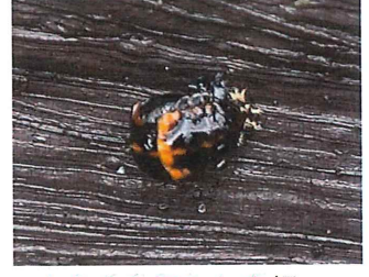
ナナホシテントウ蛹 約 8mm 雨に濡れて光 っている