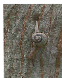
ミスジマイマ イ 8mm 大