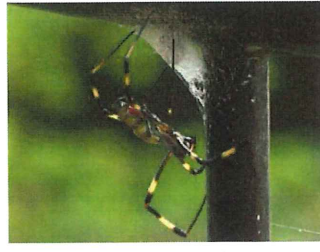
ジョロウグモと卵のう 産卵を済ませてお腹が しぼんでいる