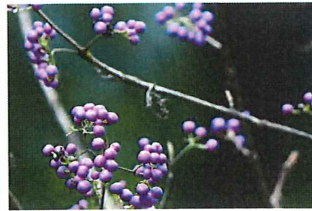
紫式部 ムラサキシキブ 葉が落ち紫の実が目立つ