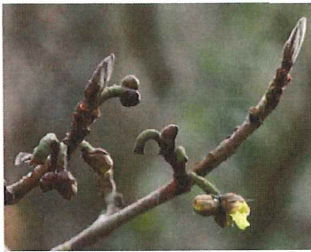
満作 マンサク 蕾がほころんで