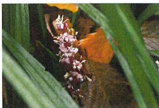
吉祥草 キチジョウソウ 庭にあると縁起が良いといわれる