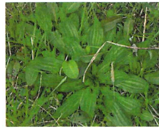
篋大葉子 ヘラオオバコ