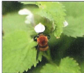
オドリコソウに マルハナバチ