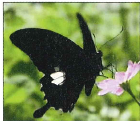
ミヤコウスレに モンキアゲハ

春の[野の花苑]には色々な形の花が咲いています。この形は受粉がうまくできるような仕組みになっています。その仕組みに合った虫たちが、甘い蜜を吸いに来たり、タンパク源たっぷりの花粉を求めに来て、ついでに受粉を成功させていきます。このような花と昆虫の関係を、のんびりと眺めるひと時を過ごされてはいかがですか。 by 風露草