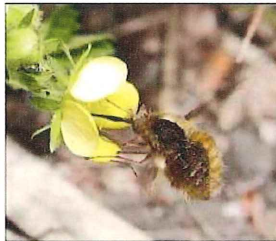
キジムシロに ピロードツリアブ