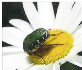
マーガレットの花 粉を食べる コアオハナムグリ