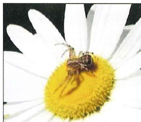
花にくる虫を狙 うクモ