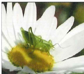
花粉を食べる バッタの幼虫