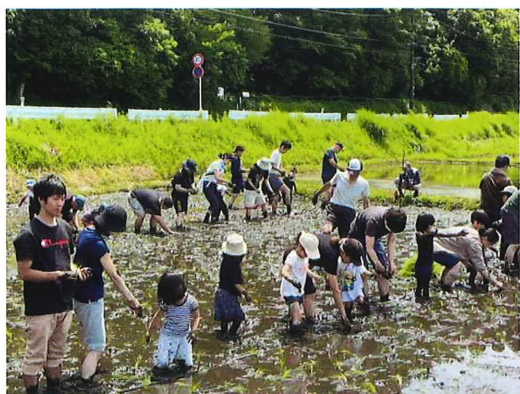
【なかよし子供園・一般参加者の田植え体験写真】

夏の間は、天王森ボランティア田んぼグループ(★随時、メンバー募集中！)にて草取り等作業を行っていき、10月14日(土)には「稲刈り体験」も予定しています(詳細は、ホームページをご参照下さい)。 by 田んぼグループ 水越