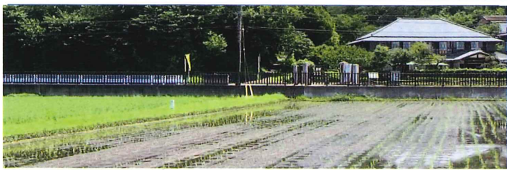
写真【公園の「泉館」と田植えを終えた田んぼ】