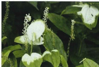
【半夏生（ハンゲショウ）】