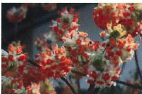
【ミツマタ(ベニミツマタ)】