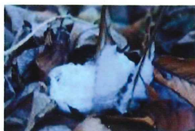
【シモバシラの氷の花】