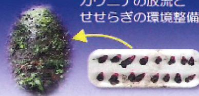
カワニナの放流と せせらぎの環境整備