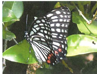
アカボシゴマダラ 53mm 特定外来生物