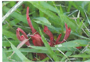
紅線香茸 ベニセンコウタケ