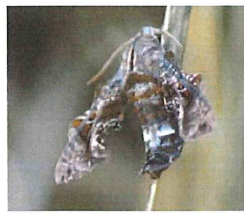
ホシヒメホウジャク 40mm