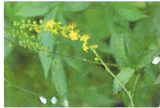
金水引 キンミズヒキ バラ科