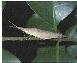
オンブバッタ幼虫. 40mm