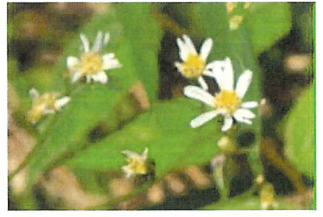
白嫁菜 シロヨメナ