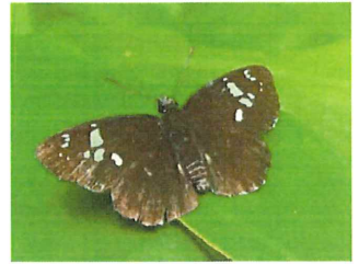
ダイミョウセセリ 40mm