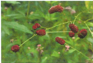
吾亦紅 ワレモコウ