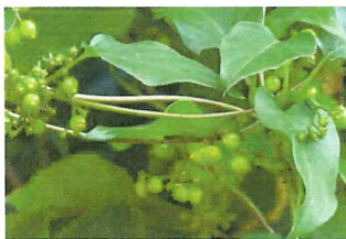
屁糞葛 ヘクソカズラ