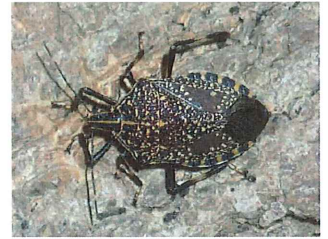
キマダラカメムシ 23mm