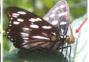
ゴマダラチョウ 85mm 幼虫の頭部をもつ個体をみつけました。頭部はしっかりつき外れません。口も頭部に埋め込まれ、触覚が1本出ているだけです。記録は少なく[生理的な変調がもたらした脱皮不全]とされています。