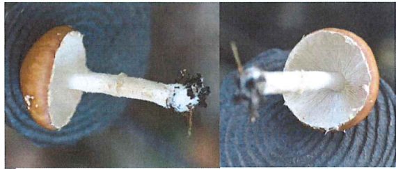
赤狐傘 アカキツネガサ 食毒不明