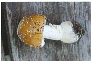
天狗茸 テングタケ 有毒