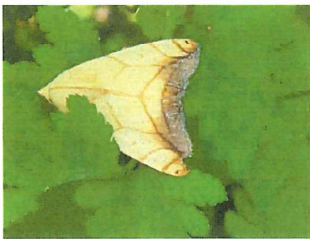
フタトガリアオイ 40mm