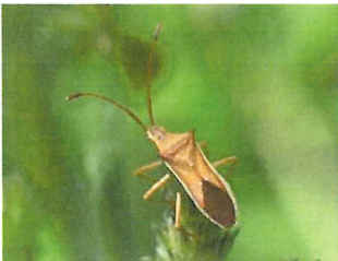
ホソハリカメムシ 11mm