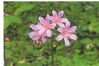
夏水仙 ナツズイセン