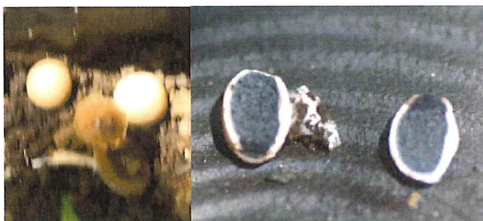
埃茸 ホコリタケ 割ると中身がいっぱい