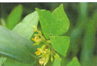
吐切豆 トキリマメ