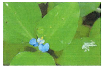
丸葉露草 マルバツユクサ 関東以西から広がる