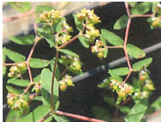
大錦草 オオニシキソウ外