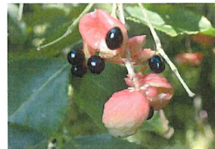
権萃 ゴンズイ 実