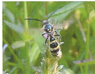
ヒメハラナガツチバチ♂ 20mm