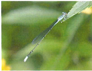
ホソミイトトンボ 38mm