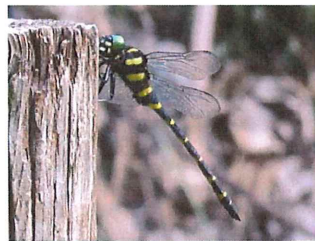
オニヤンマ 114mm 体を縦にして止まる