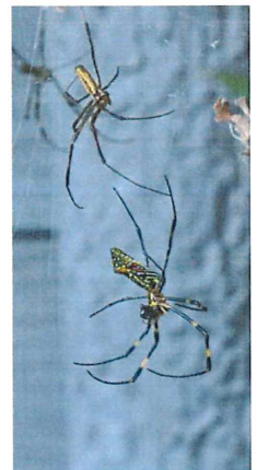
ジョロウグモ 上♂ 下♀