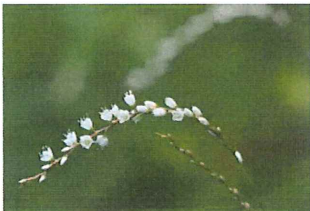
白花桜蓼 シロバナサクラタデ