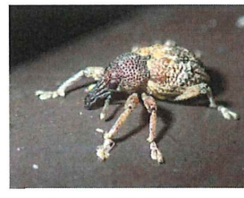
アカコブゾウムシ 8.5mm