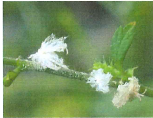
チュウゴクアミガサハ ゴロモ幼虫 7-8mm