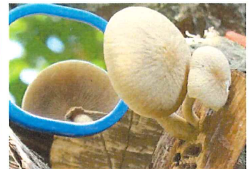
柳松茸 ヤナギマツタケ食用 烏山椒の切り株から出ていた