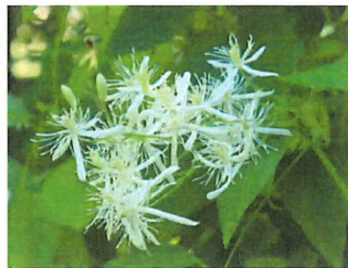
仙人草 センニンソウ 今年は花が綺麗です