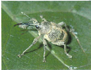
ハイロチョッキリ. 9.1mm