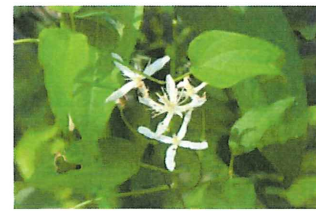
仙人掌 センニンソウ 白い綿毛が仙人の髭や白髪