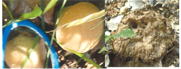
脳茸 ノウタケ 7月にも見つけたノウタケ、鏡で見ると裏もヒダがなく丸い形です。成熟すると液体から粉末状の胞子になり風で飛散します。中身が白いと食用。