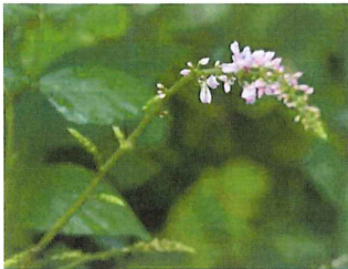
藤甘草 フジカンゾウ 実はひっつき虫です