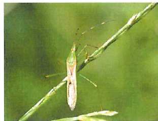
クモヘリカメムシ 17mm