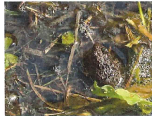
ヌマガエル 55mm 庭の水たまりに10匹以上