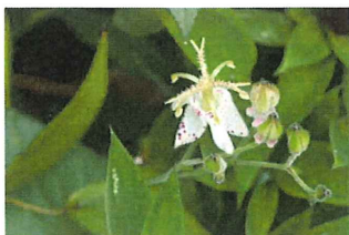
山杜鵑 ヤマホトトギス

先月から咲いている花：タイワンホトトギス・ゲンノシヨウコ (赤花・白花)・キツネノマゴ・シュウカイドウ・ハチミツソウ・キキョウ・ジンジャー・ミソハギ・カリガネソウ・キツリフネ・ムラサキツユクサ 昆虫：ツツレサセコオロギ♫・クサヒバリ♫・アオマツムシ♫・ツクツクボウシ♫・ミンミンゼミ♫・アブラゼミ♫・ナガサキアゲハ・モンキアゲハ・アゲハ・スジグロシロチョウ・ウラギンシジミ♂・アカサシガメ