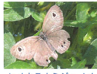
ヒメウラナミジャノメ 40mm