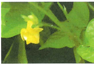
藪蔓小豆 ヤブツルアズキ アズキの原種