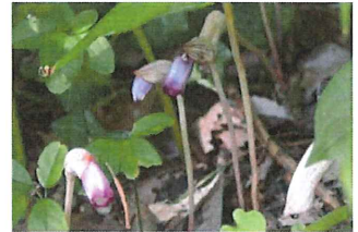
南蛮煙管 ナンバン ギセル 万葉集にも載る