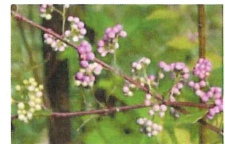
小紫 コムラサキ 実 園