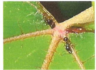
アリ 3mm アカメガシワの葉の根元にある蜜線から、蜜を吸っている。アカメガシワはアリに蜜を供給することで、他の害虫から守ってもらう。