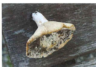
初茸 ハツタケ 食用