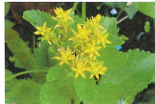
麒麟草(黄輪草)キリンソウ