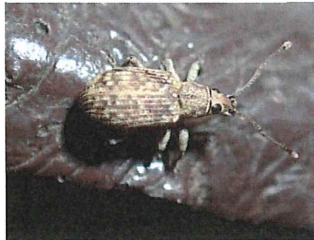
カシワクチブトゾウムシ. 5mm

昆虫：ルリタテハ・サトキマダラヒカゲ・アオスジアゲハ・カラスアゲハ・コムスジ・キマダラセセリ