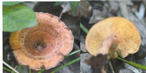
匂輪乳茸 ニオイワチチタケ 食毒不明 カレーの匂い