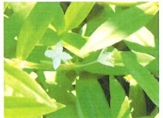
メリケンムグラ 外