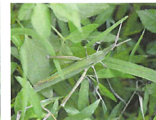
ショウリョウバッタ 50mm