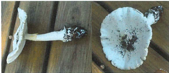
白卵天狗茸 シロタマゴテングタケ 有毒