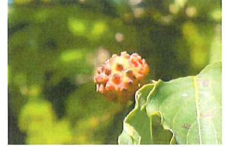
山法師 ヤマボウシ 実