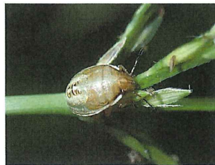
シラホシカメムシ幼虫 6mm