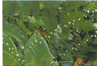
銀水引 ギンミズヒキ タデ科