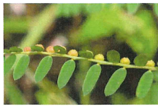
小蜜柑草 コミカンソウ 葉の裏側に小さなミカン