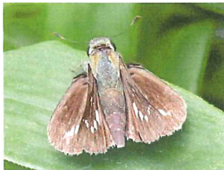
イチモンジセセリ 40mm