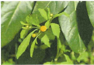
コセンダングサ 外