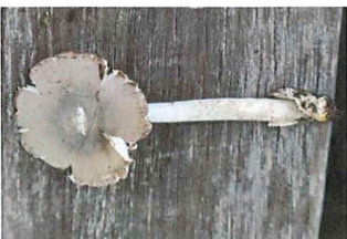
鶴茸 ツルタケ 有毒