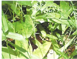
笹草 ササクサ ササ に似るが葉が柔らかい