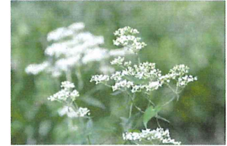
男郎花 オトコエシ