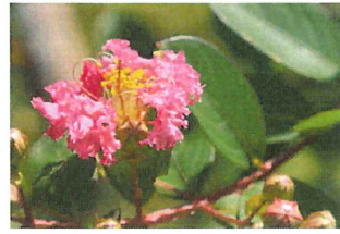
百日紅 サルスベリ