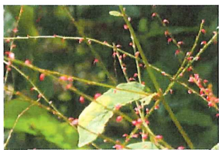
水引 ミズヒキ タデ科