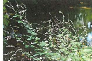
盗人萩 ヌスビトハギ