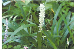
白薺蘭 シロヤブラン