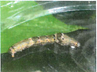
マエキオエダシヤク 中齢 幼虫 35mm 食草イヌツゲ