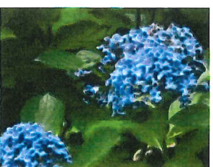
渦紫陽花 ウズアジサイ