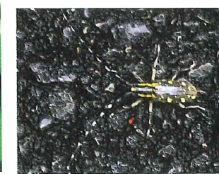
キボシカミキリ 30mm クワ科の葉を食べる