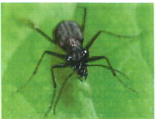
トウキョウヒメハンミョウ 10mm 生きたミミズやアリ を大アゴでつかまえる