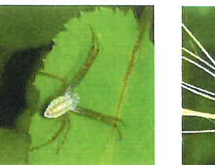
ナガコガネグモ 幼体 餌は小さな虫など