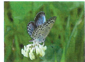
ヤマトシジミ 16mm 食草カタバミ