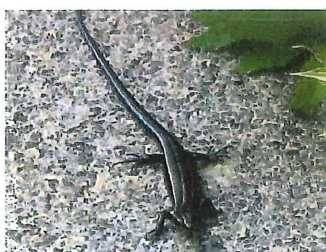
ニホントカゲ 90mm 昆虫、クモ、ミミズを食べる