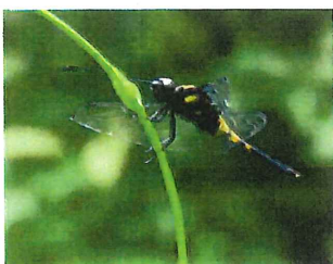
♀ オオシオカラトンボ