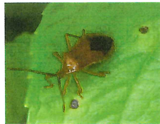
ホシハラビロヘリ カメムシ