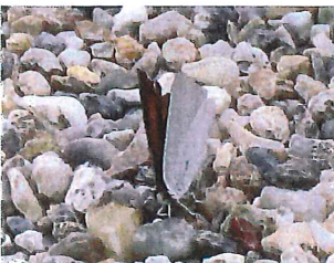
ウラギンシジミ♂ 40mm 食草 クズ、マメ科