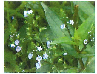
大川菖菖 オオカワヂシャ 外