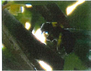
キムネクマバチ 23mm モッコクの花の香りに誘われ