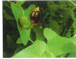
馬の鈴草 ウマノスズクサ ジャコウアゲハの食草