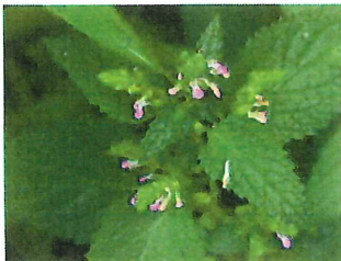
蔓苦草 ツルニガクサ ツルは地中で広がる