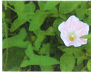
小昼顔 コヒルガオ