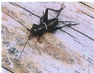
♂ エンマコオロギ幼虫