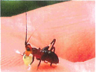
ササキリ 幼虫 15mm 食草 イネ科、虫の死骸