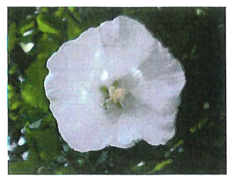
白花種 シロバナムクゲ 園