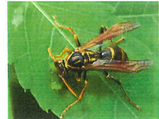
ヤマトアシナガバチ 23mm 絶滅危惧II類 青虫を捕獲