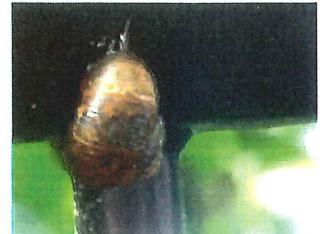
ウスカワマイマイ 20mm 殻が丸くスジがない