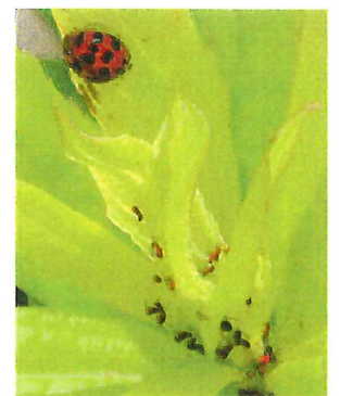
ナミテントウ 8.2mm 100以上の模様があると いわれる 下にいるアブ ラムシを食べる