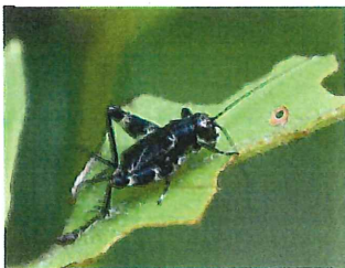
マダラスズ ♂ 19m 餌は 枯れ草、草の根、虫の死骸