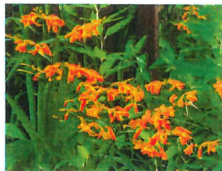
ヒメヒオウギズイセン 外