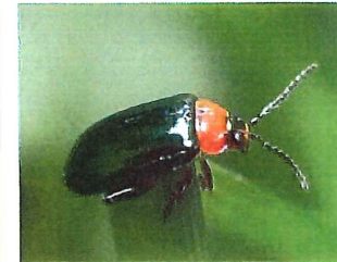
トビハムシの一種 5mm