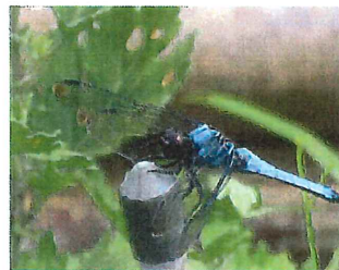
オオシオカラトンボ♂ 61mm

車軸藻 シャジクモ 神奈川県 絶滅危惧Ⅱ類に 指定 ゆめたま田んぼで保護され ている 淡水環境の止水域に生息 陸上植物の祖先に最も近縁 なグループとされている