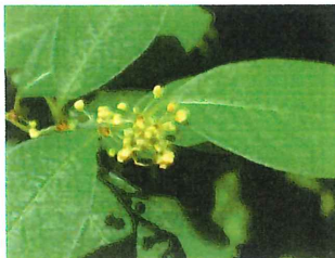
一葉萩 ヒトツバハギ 雄株