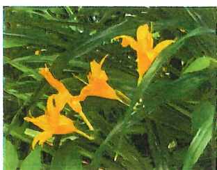
日光黄菅 ニッコウキスゲ