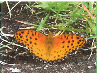
ツマグロヒョウモン♂ 38mm 食草スマレ