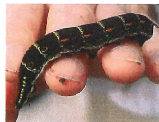
セスジスズメ終齢幼虫 75mm 里芋などを食 べるのでイモムシと呼ばれ る