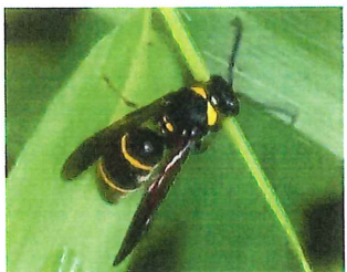
オオフトオビドロバチ 15mm