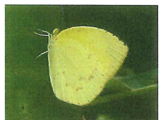
キタキチョウ 45mm 食草 ネムノキ、マメ科