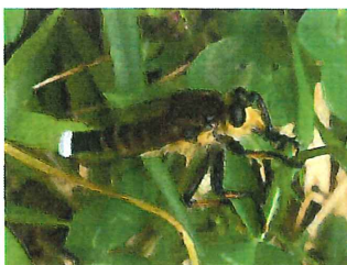
シオヤアブ♂ 30mm 餌は他の昆虫♂は白毛あり