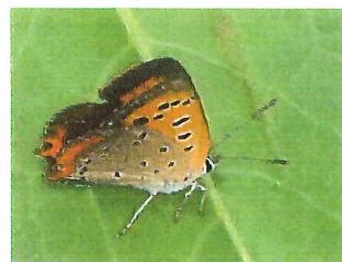
ベニシジミ♂ 35mm 食草 スイバ、ギシギシ