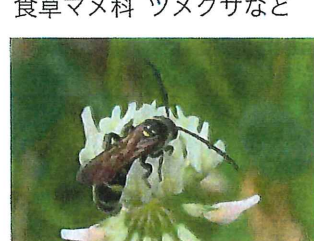
ヒメハラナガツチバチ♂ 20mm 幼虫はコガネムシ 類の幼虫に寄生