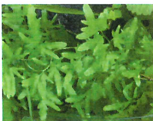
蟹草 カニクサ ツル性の シダで2~3mになり、絡 みつく