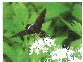
クロバナツリアブ 18mm