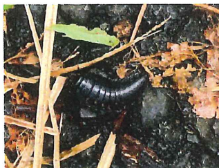
オオヒラタシデムシ幼虫 30mm 森の掃除屋さん