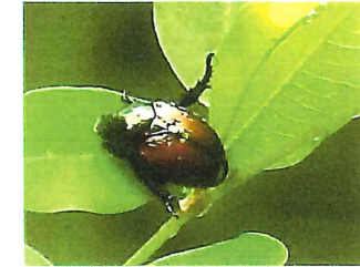
マメコガネ 13m 繁殖力 強く 重用害虫とされる