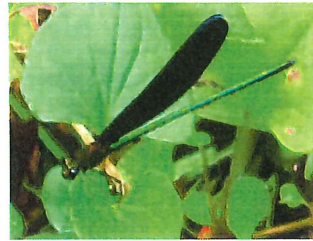
ハグロトンボ♂68mm 胴体は金緑色