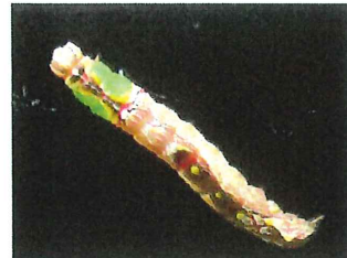
ホソバシャチホコ 終齢幼虫 40mm 食草コナラ、クヌギ