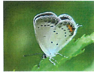
ツバメシジミ 19mm 後翅の シッポ(尾状突起)可愛い