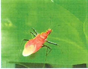
アカサシガメ 15mm 昆虫を食べる