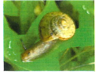
ヒダリマキマイマイ 渦の巻き方が左向き