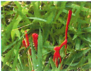
紅線香茸 ベニセンコウ タケ 芝生 高さ2~6cm