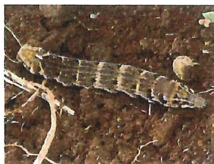
ベニスズメ終齢幼虫 70mm