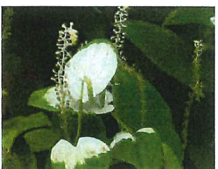
半夏生 ハンゲショウ