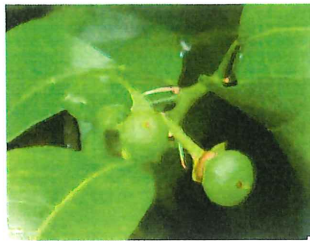
夏蜜柑 ナツミカン