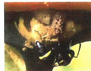
ムモントックリバチ 15mm テーブルの下に巣作り