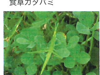
ショウリョウバッタ 幼虫 まだ翅が生えていない