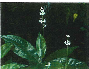
藪茗荷 ヤブミョウガ