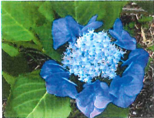
萼紫陽花 ガクアジサイ