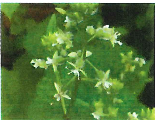
水玉草 ミズタマソウ