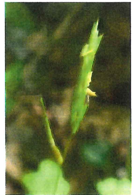
東根笹 アズマネザサ 竹 に花が咲くと枯れるというが アズマネザサは枯れるかな