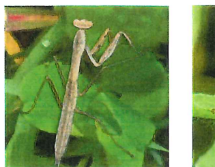
カマキリ 幼虫 50mm