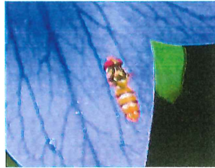
ホソヒラタアブ 11mm 蜜や花粉を食べる