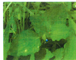
丸葉露草 マルバツユクサ 在来種 関東以西にあったが、 広がってきた 花は小さめ