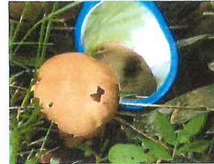
脳茸 ノウタケ 7~15cm 脳に似ているので名がつく