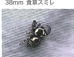
カラスハエトリ♂6mm 餌は小さな虫など