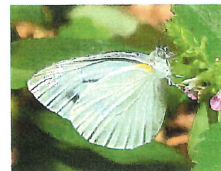
スジグロシロチョウ 60mm ♂林縁などやや暗めを飛翔