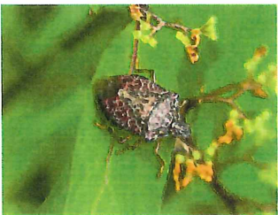
クサギカメムシ 18m 平凡かつ臭いカメムシ