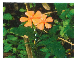
節黒仙翁 フシグロセンノウ