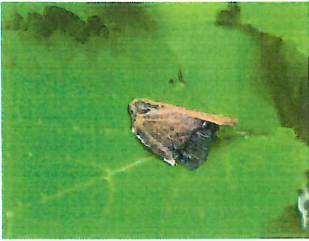
チュウゴクアミガサハゴロモ 15mm 外 先月幼虫を見る