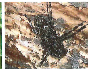
ナガゴマフカミキリ 22cm 立ち枯れ木、ホダ木につく