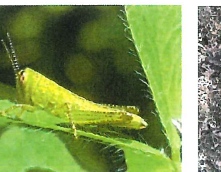
ツチイナゴ 幼虫 25mm 涙目が特徴