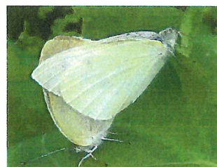
モンシロチョウ♂♀ 45mm 明るい場所好む