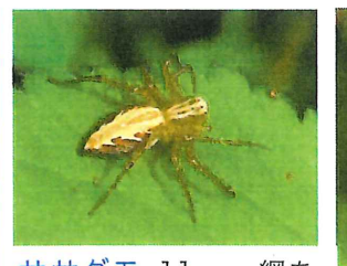
ササグモ 11mm 網を 張らず歩き回ってエサを 取る