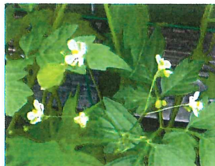
風船葛 フウセンカズラ