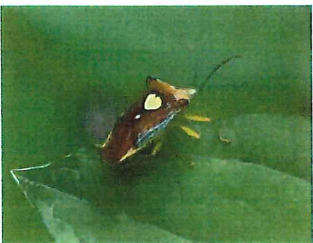
エサキモンキツノカメムシ 14mm ハートマーク目立つ