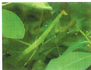
オオカマキリ幼虫