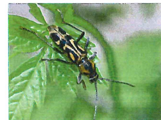
タケトラカミキリ 15m 伐採された竹で生まれた 幼虫が 材を餌とする