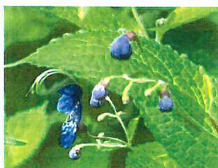
雁金草 カリガネソウ