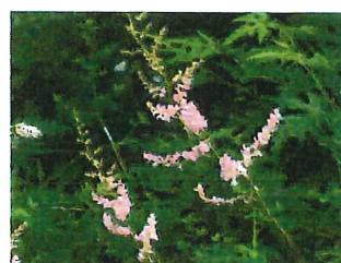
乳茸刺 チダケサシ