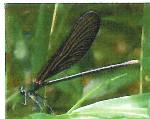
ハグロトンボ♀全体黒い 川で生まれ森で過ごす