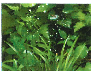
花石菖 ハナゼキショウ