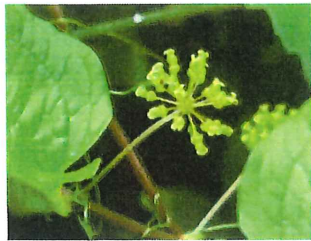
牛尾菜 シオデ 雌株 雌雄異株で実は黒い