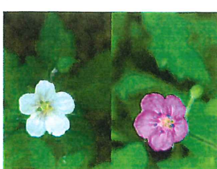
現の証拠 ゲンノショウコ