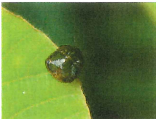
マルカメムシ 5mm 食草 クズ、ハギ 臭いあり