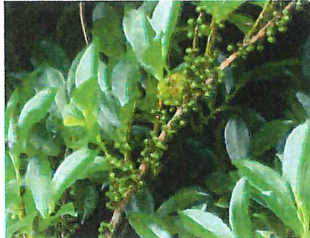
姫柎 ヒサカキ 雌雄異株 柎の代用として使われる