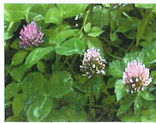
赤詰草 アカツメクサ 外