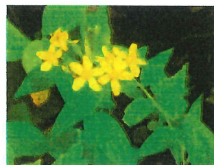
弟切草 オトギリソウ