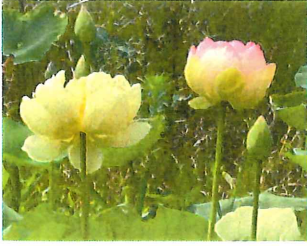
蓮 ハス 珍しい八重の蓮