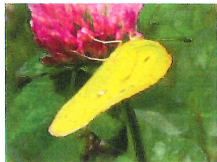
モンキチョウ 33mm 食草マメ科 ツメクサなど