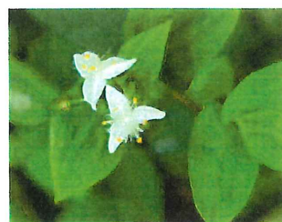
常盤露草 トキワツユクサ 外 南米原産 繁殖力盛大で 刈っても刈っても広がる