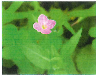
赤花夕化粧 アカバナユウゲショウ