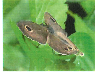
ヒメウラナミジャノメ 40mm 食草 イネ科