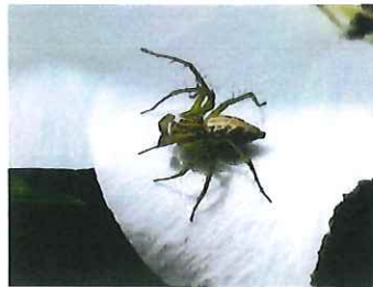
ササグモ 11mm 待ち伏せて獲物を捉える