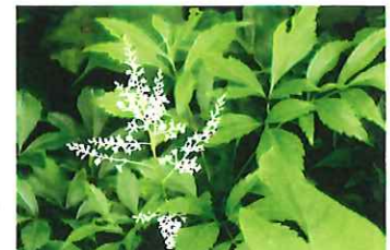
泡盛升麻 アワモリシヨ ウマ アスチルベの原種