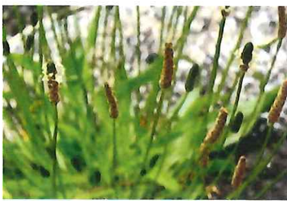
籠車前 ヘラオオバコ 外 欧州原 産 乾燥に強く道端に生育