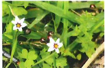
大庭石菖 オオニワゼキシ ヨウ外 花は小さく実大きい