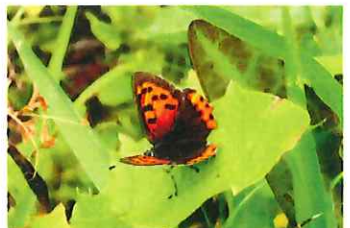
ベニシジミ 35mm 今年によく見かける