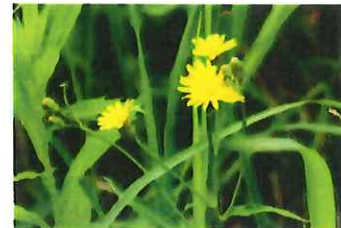
髪剃菜 コウゾリナ(髪剃り)は剃刀のこと 葉や茎の毛が剃刀みたいに鋭い