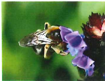
シロスジヒゲナガハナバチ 14mm 萩草に頭を入れて吸蜜