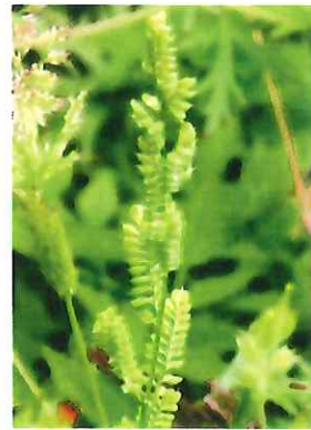
数の子草 カズノコグサ