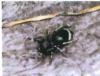
アオオビハエトリ 7mm