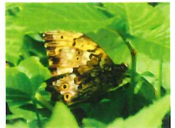
サトキマダラヒカゲ 蛾ではなく蝶です