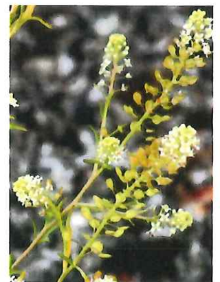
豆軍配薺 マメゲンバイナズナ 外 果実の形が相撲の軍配に似る