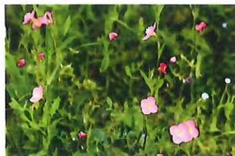
赤花夕化粧 アカバナユ ウゲショウ外 北米原産