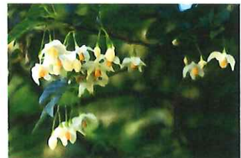
エゴノキ 実は「えぐい」ので名がつく 実はヤマガラ的好物