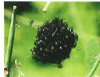
クモのまどい クモの卵のうで1回脱皮したコグモが寄り添った塊 少し刺激すると蜘蛛の子散らす状態に