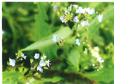
オオカワジシャ 外 欧州原産 ジシャとはレタスのこと