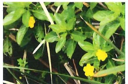
水金梅 ミズキンバイ 国の絶 滅危惧II類に指定