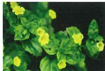
溝酸漿 ミゾホズキ 夏過ぎまで咲きます