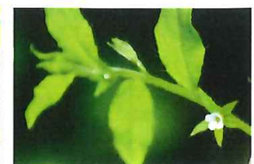
葉内花 ハナイバナ キュウリグサと同じ仲間