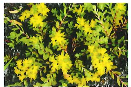
鶴万年草 ツルマンネグサ 外 朝鮮、中国原産 古い時代に渡来