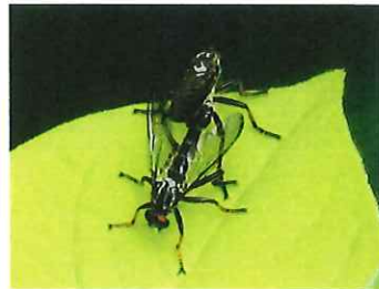
マガリケムシヒキ 23mm アブやハエを捕食