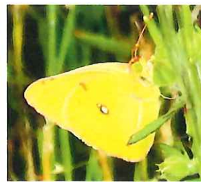
モンキチョウ ♀ 50mm