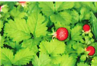
蛇莓 ヘビイチゴ 葉は明るい緑、実は 1cm大、萼片は小さい