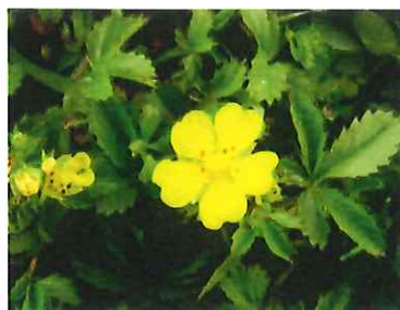
雄蛇莓 オヘビイチゴ 田んぼの畦道に生え、実がついても赤いイチゴにならない