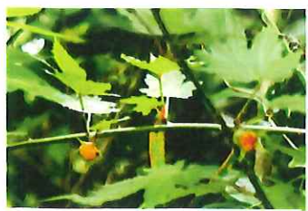
紅葉苧 モミジイチゴ 甘くて美味しい実