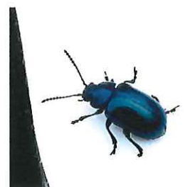
コガタルリハムシ 6mm スイバどの葉を食べる小さな葉虫 瑠璃色できれい