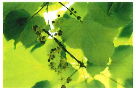
飯桐 イイギリ 木の姿がキリに似て、大きな葉で食器がわりに飯(おこわ)を包んだことから名がつく