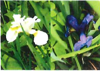
菖蒲アヤメ 白が増え 紫色が押されがちです