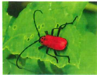
ベニカミキリ 17mm 伐採された竹に産卵