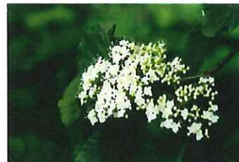
莢蒾 ガマズミ 今年は花付きが良いです