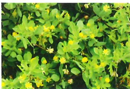
米粒詰め草 コメツブツメクサ 外 欧州、西アジア原産