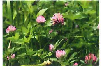
赤詰め草 アカツメクサ 外 欧州原産