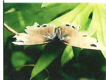
ヒメウラナミジャノメ 40mm 羽が痛んでいる