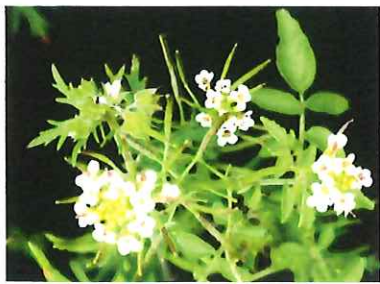
オランダガラシ 外 (クレソン)