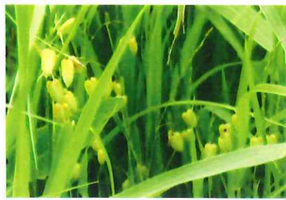
小判草 コバンソウ 外 欧州、北アフリカ原産