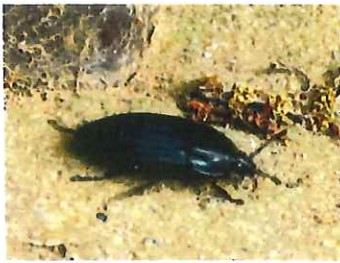
オオヒラタシデムシ 森の掃除屋さん生き物の死骸を食べる