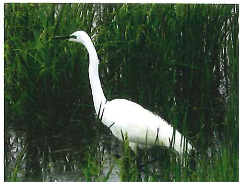
ダイサギ 繁殖期なのでクチバシ が黒く、目先は青緑色に変化