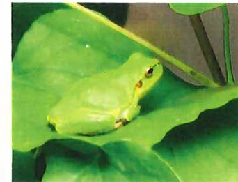
ニホンアマガエル そろそろ田んぼが賑やかに