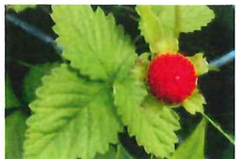
藪蛇莓 ヤブヘビイチゴ 葉は深い緑、実は1.5cm 大、萼片は大きく目立つ