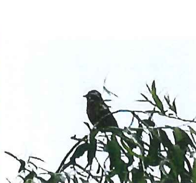
ホオジロ ♂ ヤナギの木の 天辺でさえずる