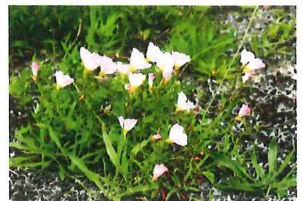
昼咲月見草 ヒルザキツキミソウ 外 北米原産