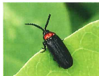
ムネクリイロボタル 8.7mm 光らないホタル 幼虫は陸生 カタツムリの仲間食べる