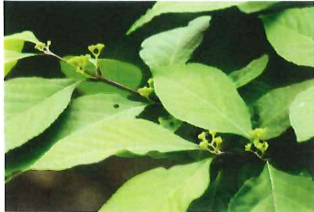
紫式部 ムラサキシキブ 花が終わり実がつき始める