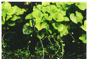
山葵 ワサビ 花が終わり茎 が伸び種が遠くに広がる