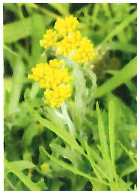
母子草 ハハコグサ