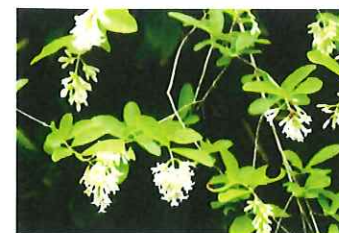
水蠟の木 イボタノキ 木に寄生する虫をイボ取りに使う