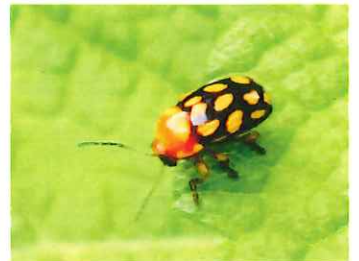
キボシツツハムシ 4mm 小さいタレ目の虫、葉を食べる