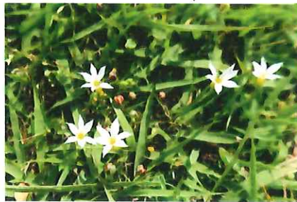
雪花庭石菖 セツカニワゼキシ ヨウ 外 コニワゼキシヨウとも