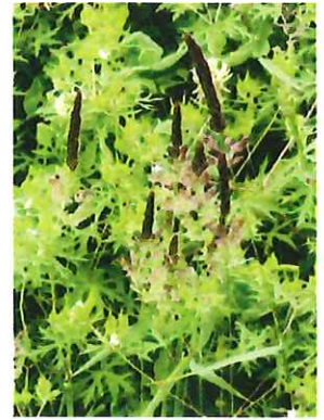
稗 還 ヒエガエリ