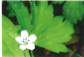
元の証拠 ゲンノショウコ 8月ごろ咲くはずなのに?