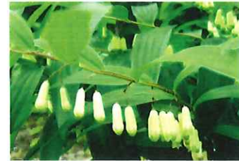
鳴子百合 ナルコユリ 田の スズメよけの鳴子に似る