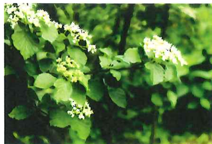
莢蒨 ガマズミ 今年は葉も虫に喰われず花付きも素晴らしく綺麗な姿が見られる