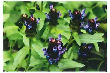
藪草 ウツボグサ 生薬 夏枯草カゴソウ