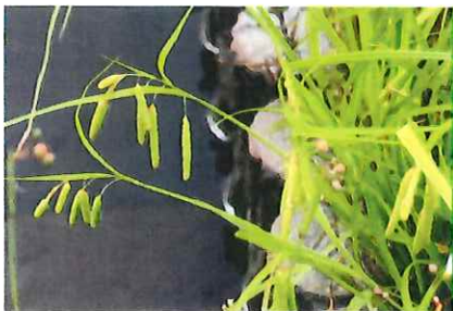
畔鳴子 アゼナルコ 小穂の垂 れ下がりを鳴子に見立てて