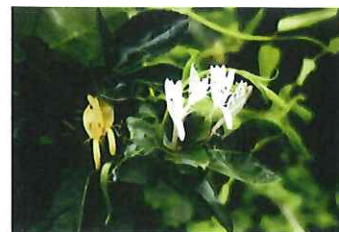
吸蔓 スイカズラ(忍冬) 花が白→黄色(金銀花)