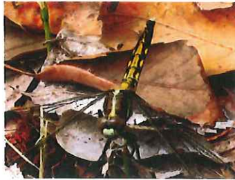
シオカラトンボ♀60mm ムギワラトンボとも言う