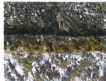
オオズアリ 4.5mm 小さなアリの大行列 10m 続く