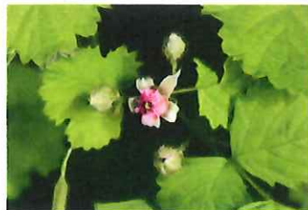
苗代苧 ナワシロイチゴ 苗代を作る時期に実がつく