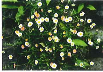
ペラペラヨメナ外 別 源平小菊 花色が白から赤