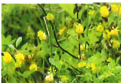
薬玉詰め草 クスダマツメクサ 外 西アジア、北アフリカ原産