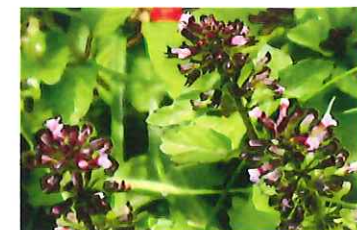
塔花 トウバナ 花序の様子を塔にたと え、湿った道端に生育