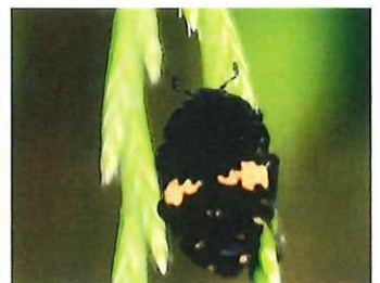
クロハナムグリ 15mm 蜜と花粉を食べる黄金虫の仲間 個体数少ない