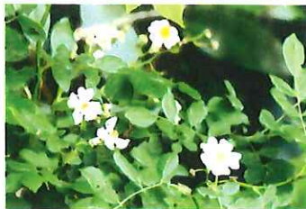
野苧 ノイバラ 森にもあるが日が当たらず花は咲かない