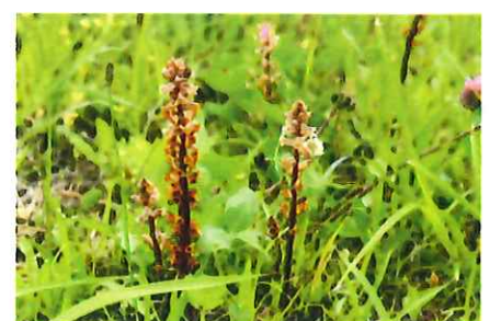
瘦根 ヤセウツボ 外 豆科のアカツメクサなどに寄生、養分を横取り