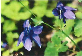
深山苧環 ミヤマオダマキ 在来種です