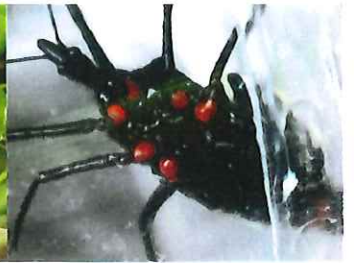
ヨコヅナサシガメ 24mm 外 肉食性 昆虫の体液を吸う 赤くて小さいダニもつくが、足の根元は赤い