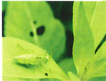
ヤブキリ幼虫 20mm 大小の幼虫がいた