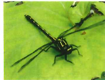
ヤマサナエ 73mm 山に生息、細流付近の林縁に飛ぶ