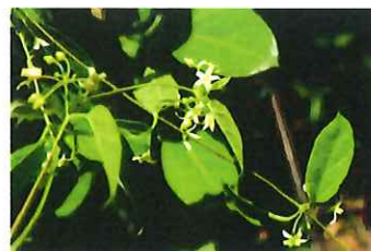
伊予蔓 イヨカズラ 海岸付近の乾燥した草地 に生育