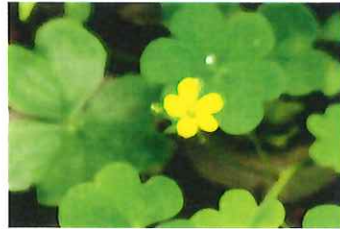
片喰 カタバミ 夕方葉を畳んで寝る