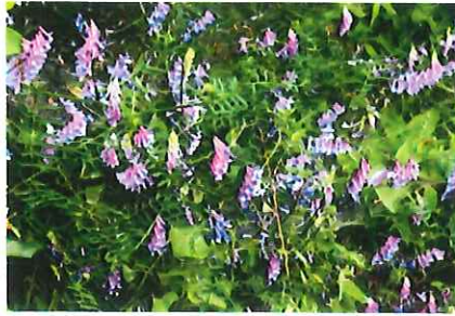
弱草藤 ナヨクサフジ 外 欧州 原産 飼料や緑肥作物 繁殖旺盛