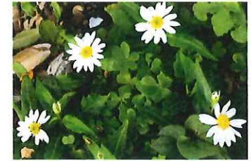
深山嫁菜 ミヤマヨメナ ミヤコワスレの原種