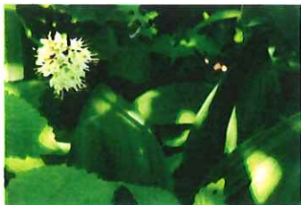
行者大蒜 ギョウジャニ ソニク花が咲くのは10年株