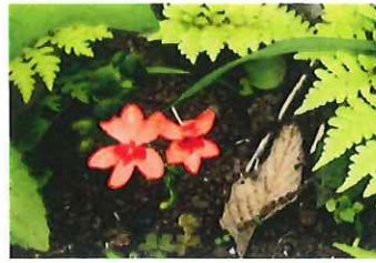
姫檜扇 ヒメヒオウギ 園 南アフリカ原産