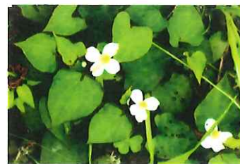
葎草 ドクダミ 生薬で十薬といい解毒剤