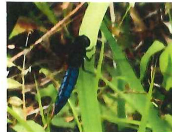
ハラビロトンボ♂42mm 今まで見つけていなかった