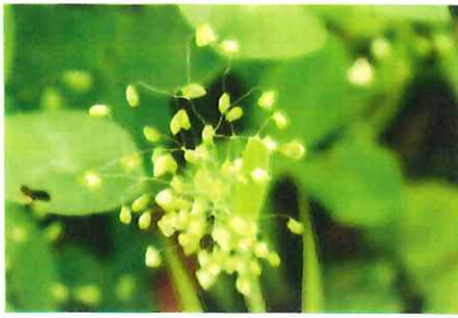
姫小判草 ヒメコバンソウ 外 欧州、北アフリカ原産