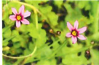
庭石菖 ニワゼキショウ 外 北米原産