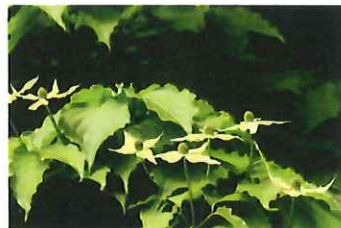
山法師 ヤマボウシ ハナミズキに似ているが花は上向きにつく