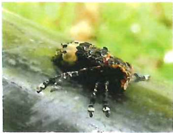
ヒトオビアラゲカミキリ 9mm