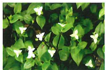
常盤露草 トキワツクサ 外 可愛いですが繁殖力強い