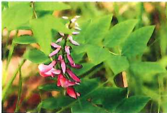
庭藤 ニワフジ コマツナギの仲間