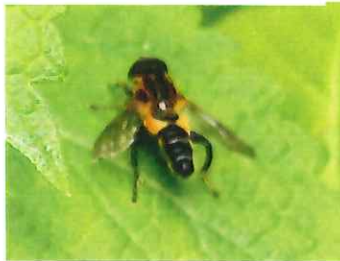
アシプトハナアブ 15mm 幼虫は水性