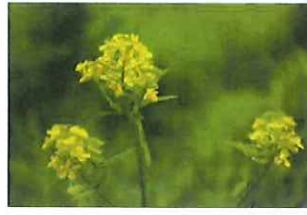
西洋芥子菜セイヨウカラシナ 外