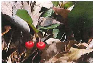
藪柑子 ヤブコウジ