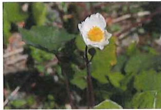
白雪芥子シラユキゲシ外中国産