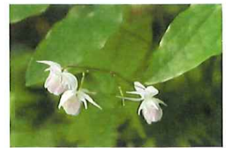
梅花碇草 バイカ イカリソウ