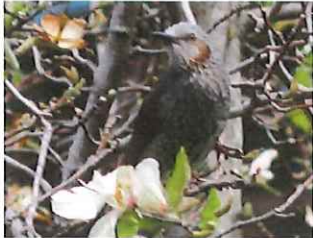
ヒヨドリ コブシを食べる