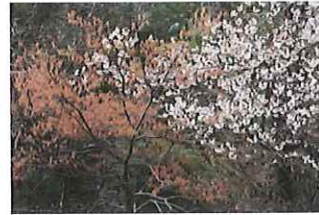
赤四手 アカシデと山桜 ヤマザクラ