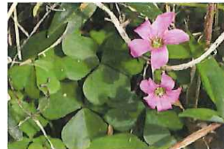
紫片喰 ムラサキカタバミ