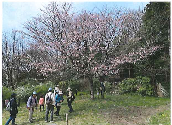
江戸彼岸 エドヒガン

昨年、幹を虫に食われ、殺虫剤を塗布しましたが、元気がなく枯れ枝も見つか、花が咲くか心配していましたが、綺麗な花を見せてくれました