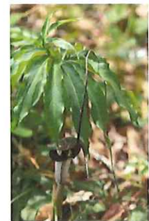
浦島草 ウラ シマソウ 釣 り糸付き