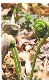
薔 ゼンマイ 毛綿は布団や 織物に使う