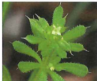
八重葎 ヤエムグラ 花 1.5mm 葉の縁や茎の棘で絡みやすい