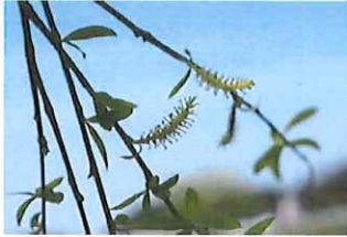
枝垂れ柳 シダレヤナギ