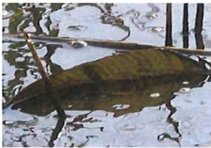
ナマズ 背ビレ 30cm