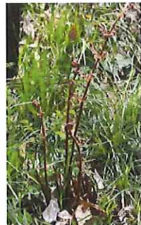
紅羊歯 ベニ シダ 芽出し