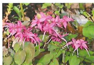
紅花碇草 ベニバナ イカリソウ 園