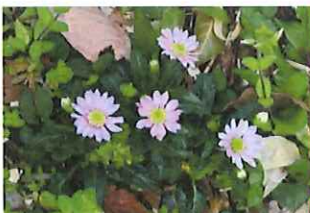
都忘 ミヤコワスレ 園