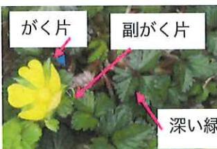
藪蛇苺 ヤブヘビイチゴ