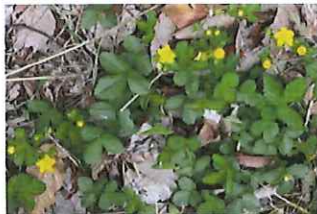
三葉土栗 ミツバツチグリ