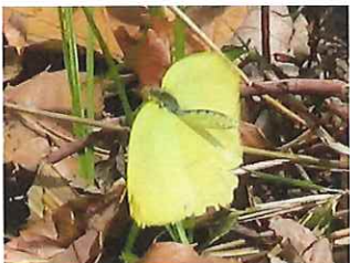
キタキチョウ 越冬個体