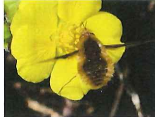
ビロードツリアブ 7-11mm

見聞きした野鳥 ウグイス・シジュウカラ 昆虫 ナミアゲハ・ヒメアカタテハ・キタキチョウ・オオイシアブ