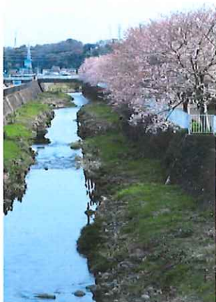
和泉川沿いのコマツオトメ