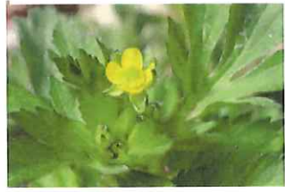
毛狐の牡丹 ケツネノボタン