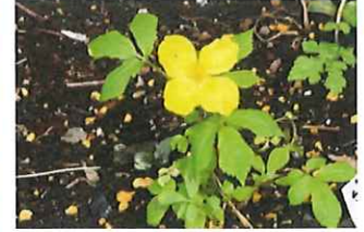
山吹草 ヤマブキソウ