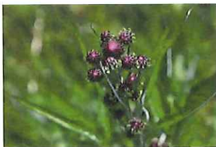
狐薊 キツネアザミ