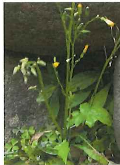
鬼田平子 オニタビラコ

茎が赤くしっかりと一本立ちをしている(左)赤鬼田平子 アカオニタビラコ、茎が緑色をして株立ちをしている(右)青鬼田平子 アオオニタビラコと分けて呼びます。