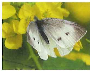
モンシロチョウ 春型♂