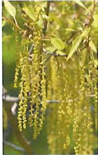
櫟 クヌギ 雄花 黄土色が かった淡緑色