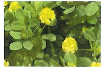
薬玉詰草 クスダマツメクサ 外