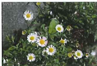
ペラペラ嫁菜 ヨメナ 外