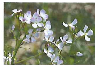
浜大根 ハマダイコン