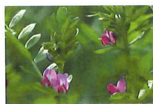
烏野豌豆カラスノエンドウ → 白花