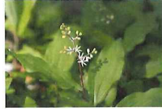
雪笹 ユキザサ 山菜としても美味しい