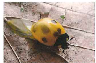
ナナホシテントウ 羽化直後は黄色の無地で、徐々に黒点が浮き上がる