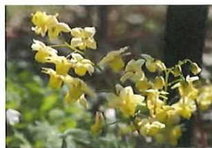
黄花碇草 キバナ イカリソウ