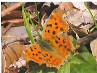
キタテハ 越冬個体