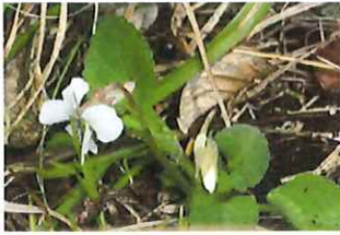
丸葉堇 マルバスマシレ