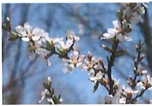
梅桃 ユスラウメ 赤い実が美味しい