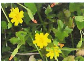
小鬼田平子コオニタピラコ