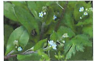
胡瓜草 キュウリグサ花2ミリ