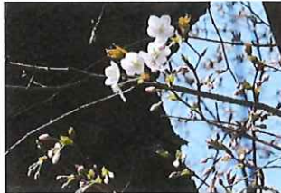
山桜 ヤマザクラ 森中央