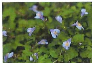
紫鷲苔 ムラサキサギゴケ