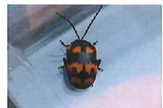
イタドリハムシ 鳥に襲われないようにテントウムシに似せています

ベニシジミ 昨年は数が少なく心配しましたが、今年は食草のイタドリ、スイバをあまり刈り取らないようにします