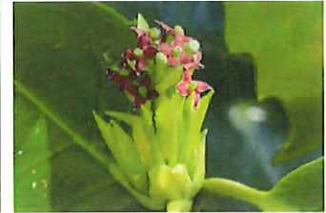
青木 アオキ 雌花