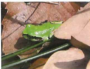
ニホンアマガエル