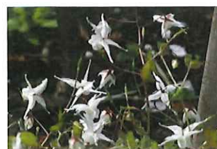
常盤碇草 トキワ イカリソウ