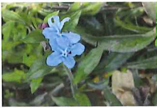
蛭蔓 ホタルカズラ