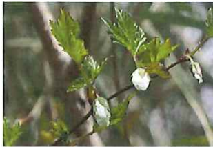
紅葉苺 モミジイチゴ