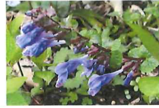
羅生門蔓 ラショウモンカズラ