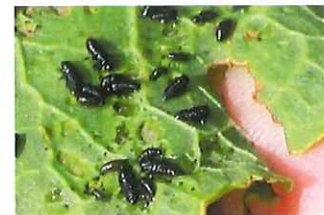
イタドリハムシ 幼虫