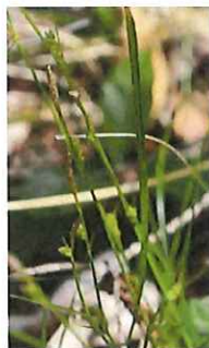
姫寒菅 ヒメ カンスゲ 葉 が細く小ぶり