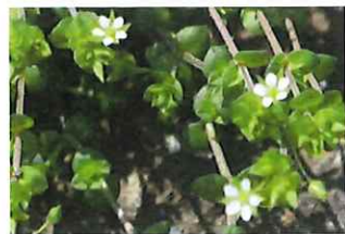
蚕の綴り ノミノツヅリ