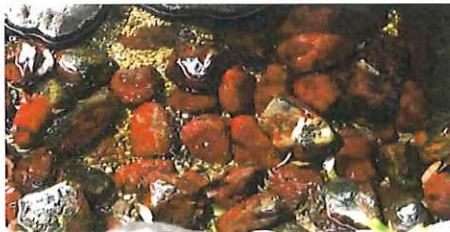
準絶滅危惧 タンスイベニマダラ

茎が赤くしっかりと一本立ちをしている(左)赤鬼田平子 アカオニタビラコ、茎が緑色をして株立ちをしている(右)青鬼田平子 アオオニタビラコと分けて呼びます。