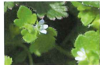
フラサバソウ外ツタノハ犬のフグリ