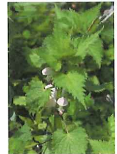
踊子草 オドリコソウ 咲き始め