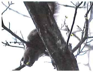
クリハラリス 新芽食べる