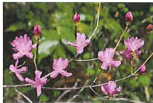
三葉躑躅 ミツバツツジ