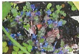
金瘡小草 キランソウ