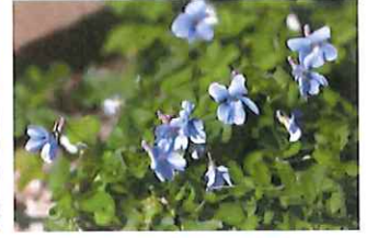
立壺堇 タチツボスミレ