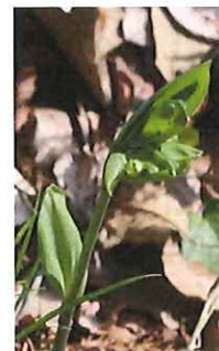
宝鐸草 ホウチャクソ ウ 芽出し