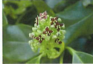
青木 アオキ 雄花