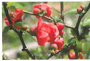
木瓜 ボケ (八重) 一重のボケは1月から咲いています