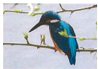
カワセミ ♂くちばしの 下が黒い