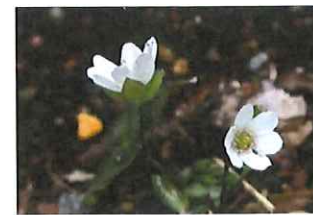
芹葉飛燕草セリバヒエンソウ 外中国産