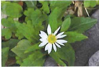
深山嫁菜 ミヤマヨメナ ミヤコワスレの原種