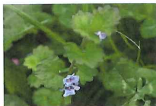
垣通し カキドオシ