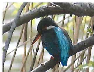
カワセミ ♀くちばしの 下が赤い