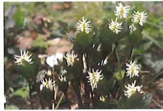
一人静 ヒトリシズカ