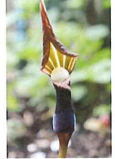
雪餅草 ユキモチソウ 場所を変えて育てます