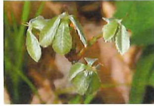
小檜 コナラ 新芽 白銀緑色