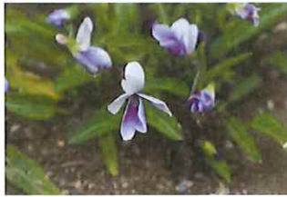
厚葉堇 アツバスマシ