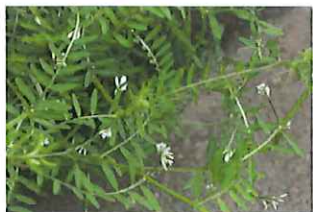
雀野豌豆 スズメ ノエンドウ 見晴らしの丘から道路縁に移動してます

昨年、幹を虫に食われ、殺虫剤を塗布しましたが、元気がなく枯れ枝も見つか、花が咲くか心配していましたが、綺麗な花を見せてくれました