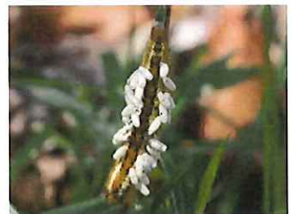
タケカレハ幼虫にコマユバチ蛹がつく ハチは幼虫の体に卵を産み、餌とする